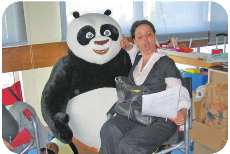
(Na sala das Educadoras do IPO... com o Panda!)