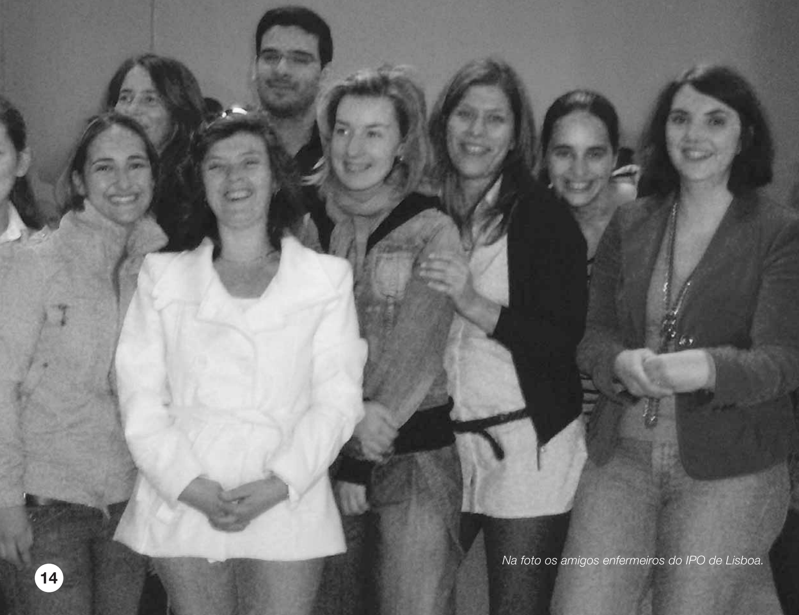
Na foto os amigos enfermeiros do IPO de Lisboa.