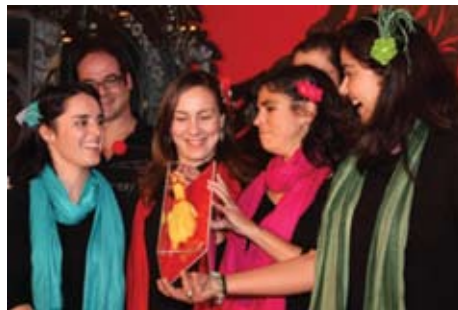
Amigos do núcleo de animação do Centro de Reabilitação e Medicina de Alcoitão