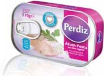
Atum Posta em Óleo Tuna Fish Chop in oil Boîte de Thon Vente à L'Huile Atún Posta en Aceite

110 gr Un. p/Cx: 1x100 Cód.: 5600441610193