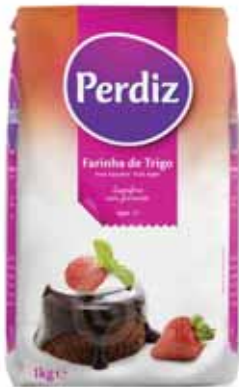
Trigo Tipo 55 Type 55 Wheat Tapez 55 Blé Trigo Tipo 55

c/Fermento, kg Un. p/Cx: 1x10 Cód.: 5600441618045