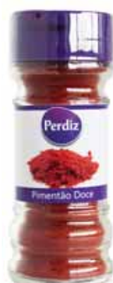
Pimentão Doce Sweet Bell Piment Pimientón Dulce