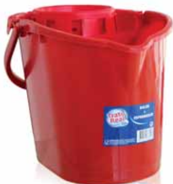
Balde + Esprededor Bucket + Wringer Seau + Presse Cubo + Escurridor