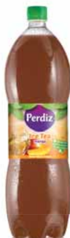
Manga Mango Mangue Manga