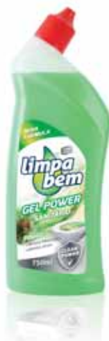
Gel Sanitário Pinho Sanitary Pine Gel Gel Sanitaire Pine Gel Sanitário de Baño Piño

750 ml Un. p/Cx: 1x9 Cód.: 5600441623032