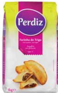
Trigo Tipo 55 Type 55 Wheat Tapez 55 Blé Trigo Tipo 55

c/Fermento, kg Un. p/Cx: 1x10 Cód.: 5600441618045