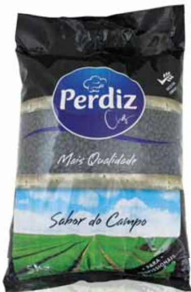
Preto Black Noir Negro

Seco 5 kg Un. p/Cx: 1x1 Cód.: 5600441610568