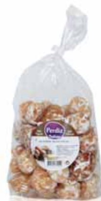
Beijinhos Tradicionais Tradicional Kisses Baisers Traditionnels Besitos Tradicionales

300 gr Un. p/Cx: 1x12 Cód.: 5600441615365