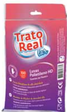
Luvas Polietileno Polythene Gloves Gants en Polyethylene Guantes Polietileno

100 un, Tam S Un. p/Cx: 1x10 Cód.: 5600441665049