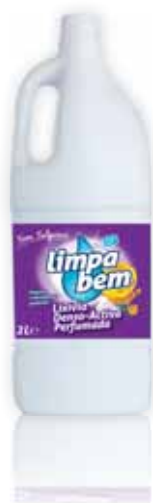
Denso-Activa Perfumada Perfumed Denso-Active Permet Dense Parfumé Denso-Activa Perfumada