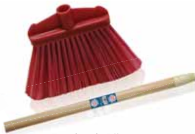
Espalmada Rija Tough Flattened Difficile Aplatie Cepillo Rijida

Cabo de Madeira Un. p/Cx: 1x6 Cód.: 5600441668132