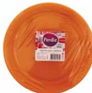
Pratos Refeição Descartáveis Laranjas Orange Disposable Plates Meal Orange jetables Assiettes Repas Platos Comida Desechables Naranjas

22 cm, 25 un Un. p/Cx: 1x1 Cód.: 5600441619769