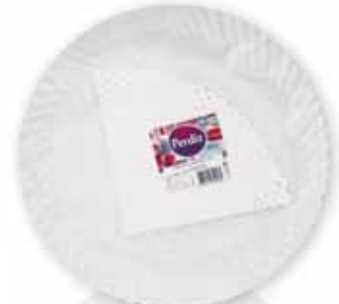
Pratos Cartão c/ Naperon Dishes Card with Naperon Carte avec des Plats Naperon Platos Cartón c/Napperon

Nº 6 - 1 un Un. p/Cx: 10x10 Cód.: 5600441619578