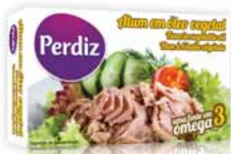
Atum em Óleo Vegetal Tuna in Vegetable Oil Thon à L'huile Végétale Atún en Aceite Vegetal

110 gr Un. p/Cx: 1x100 Cód.: 5600441610773