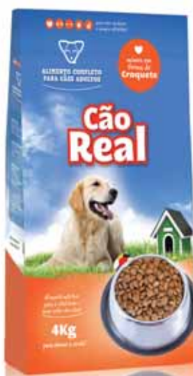
Cão Dog Chien Perro