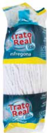
Recarga (Algodão Gigante) Refill (Giant Cotton) Recharge (Coton Géant) Recarga (Algodón Gigante)