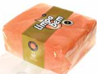
Folha Dupla Salmão Salmon Double Sheet Double Feuille Saumon Doble Hoja Naranja

40x40 cm, 40 un Un. p/Cx: 1x24 Cód.: 5600441628082