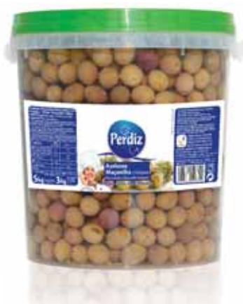
Maçanilha c/Oregãos 291/320 Maçanilha with Oregano 291/320 Maçanilha avec Origan 291/320 Maçanilla c/Organos 291/320