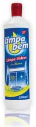
Limpa Vidros Glass Cleaner Détergent de Vitre Limpia Cristales

LIMPA SUPERFÍCIES | SURFACES CLEANER | NETTOYAGE DES SURFACES | LIMPIA SUPERFICIES