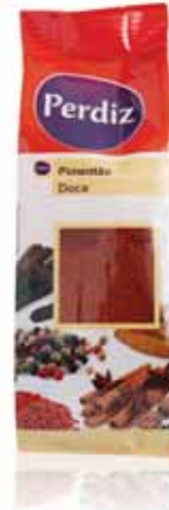
Pimentão Doce Sweet Bell Piment Pimentón Dulce