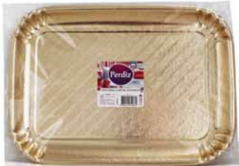
Travessa Cartão Dourada Platter Golden Card Plateau Golden Card Bandeja Cartón Dorada

Nº 6 - 1 un Un. p/Cx: 10x10 Cód.: 5600441619660