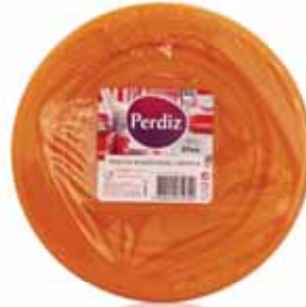
Pratos Sobremesa Descartáveis Laranjas Orange Disposable Dessert Plates Dessert Jetables Plaques Orange Platos Postre Desechables Naranjas