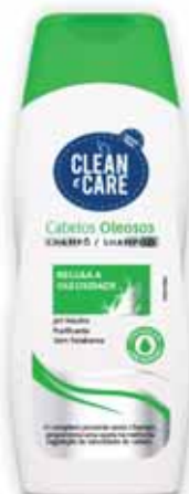
Cabelos Oleosos Oily Hair Cheveux Gras c/Grasa

250 ml Un. p/Cx: 1x12 Cód.: 5600441654036