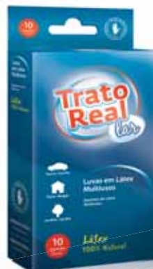
Luvas Látex Multiusos Multipurpose Latex Gloves Gants en Latex à Usages Multiples Guantes Látex Multiusos

100 un, Tam Único Un. p/Cx: 1x100 Cód.: 5600441665001