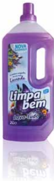
Lavanda Lavender Lavande Lavenda