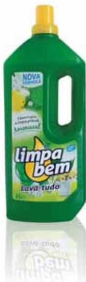
Amoniaca Ammoniacal Ammoniaque Amoniaca