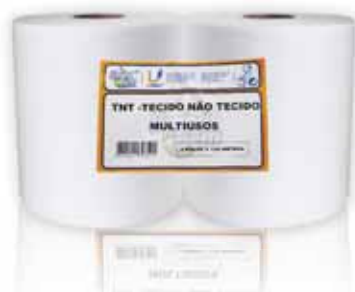
Rolo TNT (Tecido Não Tecido) Roll TNT (Nonwoven Fabric) Rouleau TNT (Non-Tissés) TNT Rollo (Tejido no Tejido)

2 Rolos, 130 mt Un. p/Cx: 1x2 Cód.: 5600441628501