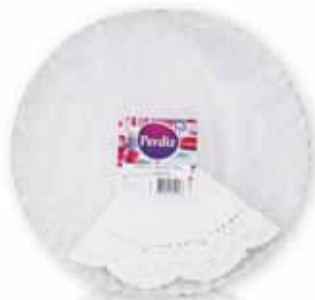
Pratos Cartão c/ Naperon Dishes Card with Naperon Carte avec des Plats Naperon Platos Cartón c/Napperon

Nº 5 - 1 un Un. p/Cx: 10x10 Cód.: 5600441619561