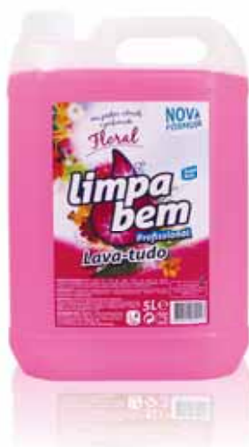
Lava-tudo Floral Purpose Cleaners Floral Nettoyants Tout Floral Limpiador Floral