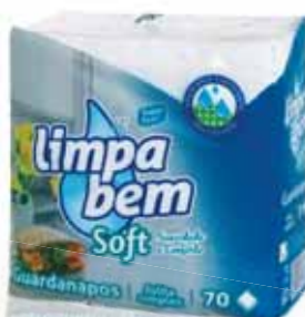
Soft Folha Simples Soft Simple Sheet Soft Feuille Simple Soft Hoja Simple

22x22 cm, 100 un Un. p/Cx: 1x30 Cód.: 5600441628358