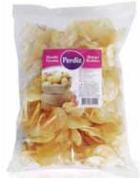
Frita Rodelas Roundels Chips Frites Tranchés Frita en Rodajas

100 gr Un. p/Cx: 1x30 Cód.: 5600441614528