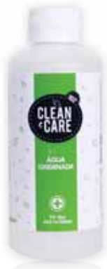
Água Oxigenada Oxygenated Water Le Peroxyde d'Hydrogène Agua Oxigenada

250 ml Un. p/Cx: 1x12 Cód.: 5600441650021