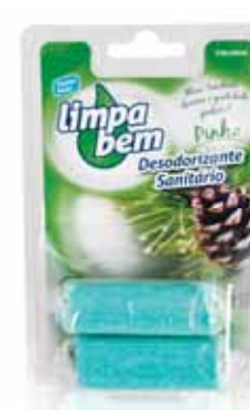
Bloco Sanitário Pinho Sanitary Block Pine Bloc Sanitaire Pine Colgador WC Pino

Recarga, 2x40 gr Un. p/Cx: 1x12 Cód.: 5600441626057