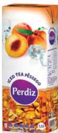
Pêssego Peach Pêche Melocotón

200 ml Un. p/Cx: 3x8 Cód.: 5600441617505