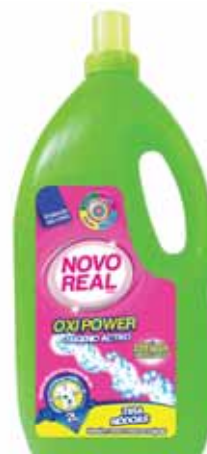
Oxi Power Lixívia Delicada Oxi Power Delicate Leachs Oxi Power Lessive Délicat OxiPower Lejja Delicada

750 ml Un. p/Cx: 2x8 Cód.: 5600441636001