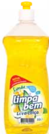
Limão Lemon Citron Limón