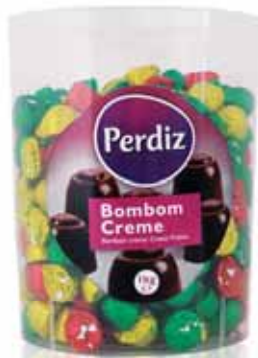
Creme Cream Crème Crema

Frasco Vidro kg Un. p/Cx: 1x6 Cód.: 5600441615075