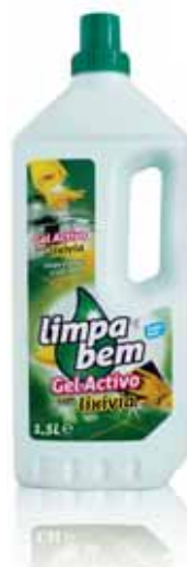
Gel Activo com Lixívia Active Leaches Gel Gel Actif avec Lessive Gel Activo con Lejía

1,5 Lt Un. p/Cx: 1x12 Cód.: 5600441623131