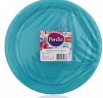
Pratos Refeição Descartáveis Azuis Blue Disposable Plates Meal Bleu Jetables Assiettes Repas Platos Comida Desechables Azules

22 cm, 25 un Un. p/Cx: 1x1 Cód.: 5600441619752