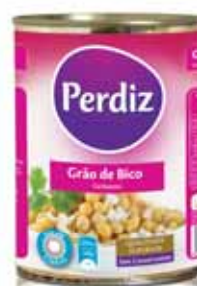
Grão de Bico Chickpeas Pois Chique Garbanzo

Lata 420 gr Un. p/Cx: 1x12 Cód.: 5600441610131