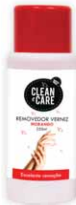
Morango Strawberry Fraise Fresa

200 ml Un. p/Cx: 1x16 Cód.: 5600441650045