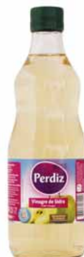
Sidra (vidro) Cider (glass) Cidre (verre) Sidra (vidrio)

500 ml Un. p/Cx: 1x20 Cód.: 5601517161090