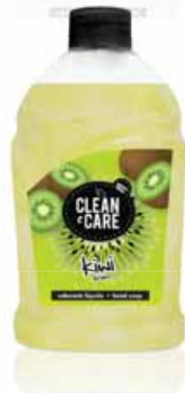
Kiwi Kiwi Kiwi Kiwi

Recarga, 500 ml Un. p/Cx: 1x6 Cód.: 5600441652100