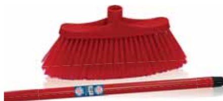
Espanador Mop Ensemble de Balai Espanador

Cabo Metálico Un. p/Cx: 1x6 Cód.: 5600441668088