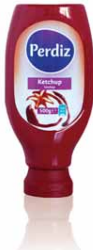
Ketchup Top Down Ketchup Top Down Ketchup Top Down Ketchup Top Down

250 gr Un. p/Cx: 1x6 Cód.: 5601517161427