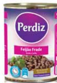
Frade Black - Eyed Niébé Pintas

Lata 420 gr Un. p/Cx: 1x12 Cód.: 5601474387014