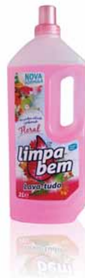
Floral Floral Floral