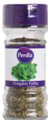
Oregãos Folha Origans Leaf Origan Oréganos Hoja