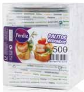
Palitos Individuais Individual Toothpick Dispensecure-dents Individuels Palillos Individuales

80 un Un. p/Cx: 24x12 Cód.: 5600441619097