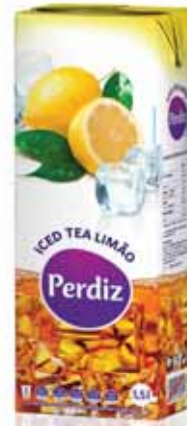
Limão Lemon Citron Limón

1,5 Lt Un. p/Cx: 1x8 Cód.: 5600441617277