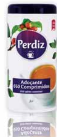
Adoçante Doseador Sweetener Dispenser Édulcorant Distributeur Sacarina Dosificador

100 un Un. p/Cx: 1x72 Cód.: 5600441615730