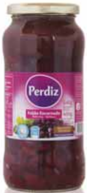
Encarnado Frasco Red Vial Rouges Bouteille Encarnado Frasco

FEIJÃO, GRÃO | BEAN, GRAIN | HARICOT, GRAIN | ALUBIAS, GARBANZOS