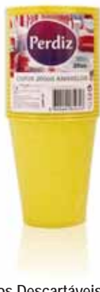
Copos Descartáveis Amarelos 200 ml Yellow Disposable Cups 200 ml Tasses Jaune Jetables 200 ml Vasos Desechables Amarillos