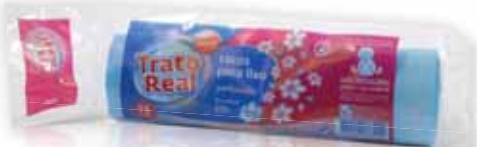
Sacos Lixo Perfumados c/ Fecho Azul Scented Trash Bags with Blue Buckle Sacs à Ordures Parfumées avec Bleu Boucle Bolsa Basura Perfumada Cierre Azul

55x55, 30 Lt, 15 un Un. p/Cx: 5x10 Cód.: 5600441668002