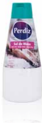
Sal Mesa Salt Table Le Sel de Table Sal Mesa

Refinado, 250 gr Un. p/Cx: 1x20 Cód.: 5601118000361