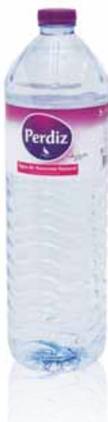
Água de Nascente Spring Water L'eau de Source Agua de Manantial

0,5 Lt, PACK 24 Un. p/Cx: 1x24 Cód.: 5600441617215