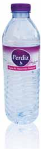
Água de Nascente Spring Water L'eau de Source Agua de Manantial

0,33 Lt, PACK 24 Un. p/Cx: 1x24 Cód.: 5600441617000