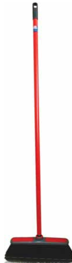
Anti-Choque Anti-Shock Anti-Choc Anti-Shock

c/ Cabo e Borracha Un. p/Cx: 1x6 Cód.: 5600441668118