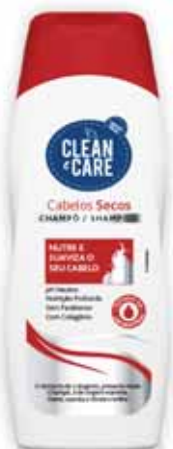
Cabelos Secos Dry Hair Cheveux Secs Cabello Seco

250 ml Un. p/Cx: 1x12 Cód.: 5600441654067