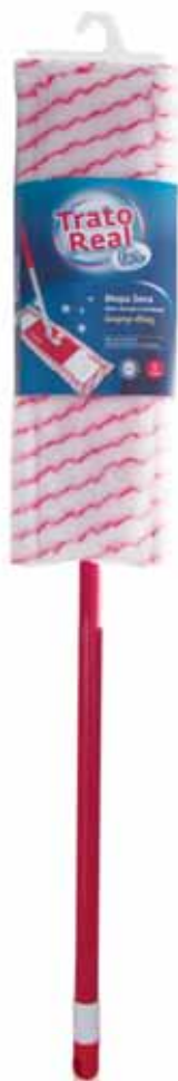
Mopa Seca c/ Cabo Metálico Extensível Dry Mop with Extendable Metallic Cab Vandrouille avec Métallique Extensible Cable Mopa Seca c/Mango Metálico Extensible

45 cm Un. p/Cx: 1x12 Cód.: 5600441668187