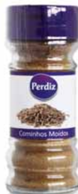
Cominhos Moídos Milled Cumins Sachet Cominos Molidos