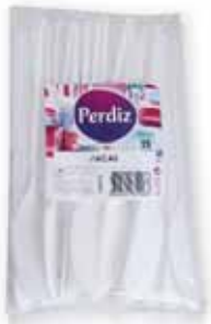
Facas Brancas White Knives Couteaux Blancs Cuchillos Blancos

25 un Un. p/Cx: 10x10 Cód.: 5600441619233