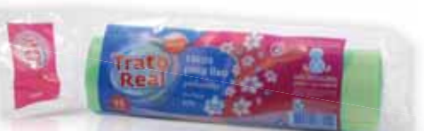
Sacos Lixo Perfumados c/ Fecho Verde Scented Trash Bags with Green Buckle Sacs à Ordures Parfumées avec Vert Boucle Bolsa Basura Perfumada Cierre Verde

50 Lt, 10 un Un. p/Cx: 6x10 Cód.: 5600441668019