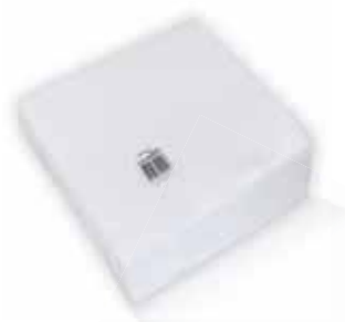
Guardanapos Bar L Napkins Bar L Serviettes Bar L Servilletas Bar L

17x17 cm, 50 maços (4500 un) Un. p/Cx: 30x150 Cód.: 5600441628129