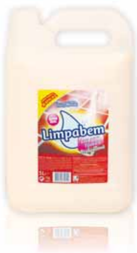
Cera Tijoleira Neutra Wax Tile Cire Terre Cuite Neutre Cera Baldosa Neutra