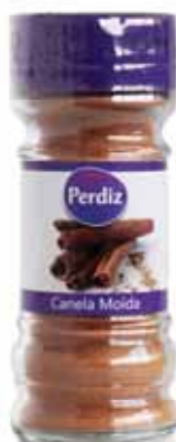
Canela Moída Ground Cinnamon Cannelle Moulu Canela Molida