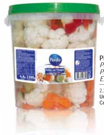
Pickles Balde Pickles Bucket Pickles Seau Encurtidos Balde

800 gr Un. p/Cx: 1x6 Cód.: 5600441613286