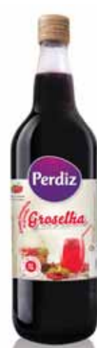
Groselha Gooseberry Groselle Grosella

Lata 33 cl Un. p/Cx: 6x4 Cód.: 5600441617550