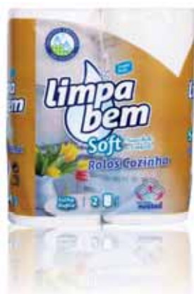
Rolo de Cozinha Kitchen Rolls Rouleaux de Cuisine Rollos de Cocina

20 mt, 2=4 Rolos Un. p/Cx: 1x12 Cód.: 5600441628457