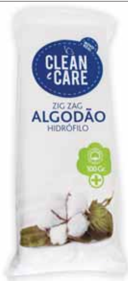
Algodão Zig Zag Zig Zag Cotton Zig Zag Coton Algodón Zig Zag

40 gr Un. p/Cx: 18x10 Cód.: 5600441651141