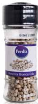
Pimenta Branca Moída c/Moinho Grain White Pepper Vial with Mill Poivre Blanc Grains Jar avec Moulin Pimienta Blanca Grano c/ Molinillo