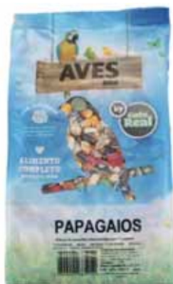
Papagaios Parrots Perroquets Papagayos

750 gr Un. p/Cx: 1x12 Cód.: 5600441685054