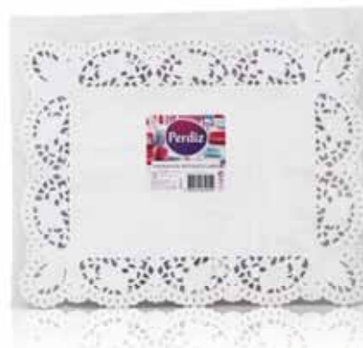
Naperons Retangulares Rectangular Doilies Napperons Rectangulaires Napperons Retangulares

35 cm - 100 un Un. p/Cx: 1x10 Cód.: 5600441619547