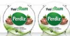
Atum Tuna Thon Atún

Pack 30 Un. p/Cx: 3x10 Cód.: 5600441610759