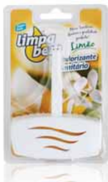
Bloco Sanitário Limão Sanitary Block Lemon Bloc Sanitaire Citron Colgador WC Limão

40 gr Un. p/Cx: 1x12 Cód.: 5600441626033