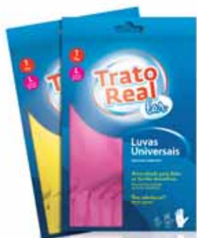
Universais Rosa e Amarelo Universal Pink and Yellow Universelles Rose et Jaune Universales Rosa y Amarillo

1 Par Tam. L Un. p/Cx: 1x12 Cód.: 5600441665094 (Amarela) Cód.: 5600441665131 (Rosa)