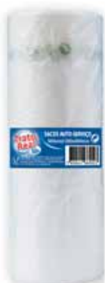
Saco em Rolo Bag on Roll Sac sur Rouleau Bolsa en Rollo

250x350, 500 un Un. p/Cx: 1x10 Cód.: 5600441669016