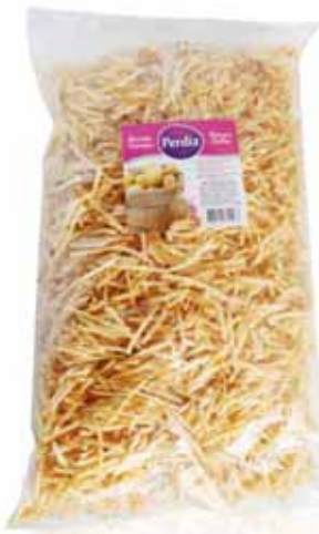
Frita Palha Thatched Chips Frites Paille Patata paja

180 gr Un. p/Cx: 1x30 Cód.: 5600441614504