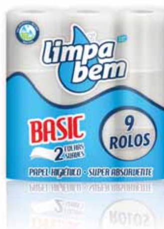
Basic (Folha Dupla) Basic (Double Sheet) Basic (Feuille Double) Basic (Doble Hoja)

4=12 rolos Un. p/Cx: 1x15 Cód.: 5600441628365