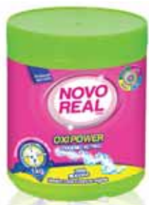
Oxi Power Pó Oxi Power Powder Poudre d'Oxi Power OxiPower Po

500 ml Un. p/Cx: 3x8 Cód.: 5600441636025