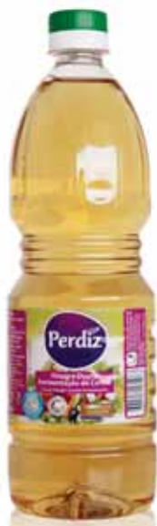
Dupla Fermentação Double Fermentation Double Fermentation Doble Fermentación

500 ml Un. p/Cx: 1x20 Cód.: 5601517161076