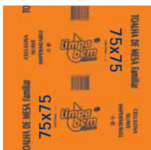
Toalha de Mesa, 1 Folha Paper Tablecloths, 1 Sheet Serviettes en Papier pour Table, 1 Feuille Toalha de Mesa, 1 Folha

70x70 cm, 220 un Un. p/Cx: 1x1 Cód.: 5600441628198