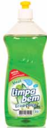
Maça Apple Pomme Manzana