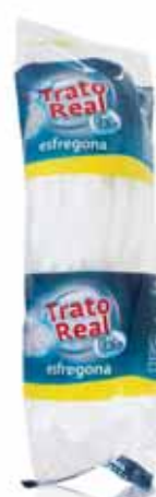
Recarga (Ecológica) Refill (Ecological) Recharge (Écologique) Fregona (Ecológica)