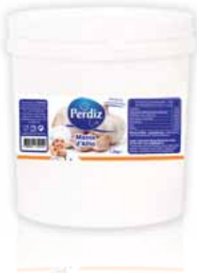
Massa de Alho Garlic Mass Ail Masse Masa de Ajo

200 gr Un. p/Cx: 1x12 Cód.: 5600441612098