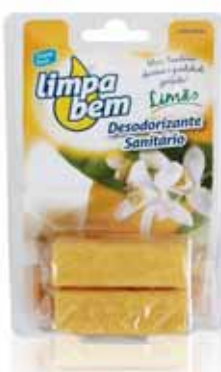
Bloco Sanitário Limão Sanitary Block Lemon Bloc Sanitaire Citron Colgador WC Limão

Recarga, 2x40 gr Un. p/Cx: 1x12 Cód.: 5600441626071