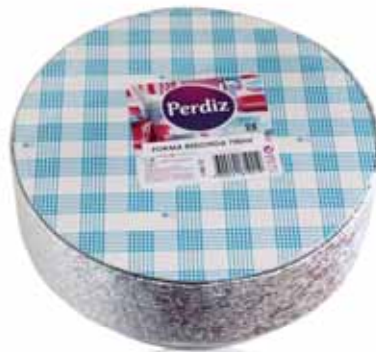
Forma Redonda Round Form Formes Tour Forma Redonda

1500 ml - 25 un Un. p/Cx: 1x25 Cód.: 5600441619325