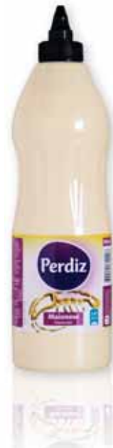
Maionese Mayonnaise Mayonnaise Mayonesa

500 gr Un. p/Cx: 1x6 Cód.: 5600441612289