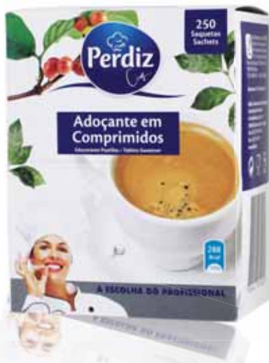
Adoçante Caixa Expositora Sweetener Box Exhibitor Boîte de Édulcorant Exposit Sacarina Caja Expositora

90 gr Un. p/Cx: 1x12 Cód.: 5600441615891