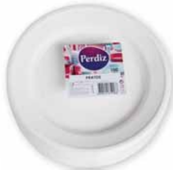
Pratos Segundo Seconds Dishes Assiette Segundos Platos

100 un Un. p/Cx: 1x1 Cód.: 5600441619295