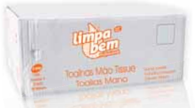
Toalhas Mão Tissue Paper Hand Towels Tissue Serviettes en Papier pour le Main Tissues Toallas de Mano Tissue

14x14 cm, 50 maços (8000 un) Un. p/Cx: 50x140 Cód.: 5600441628112