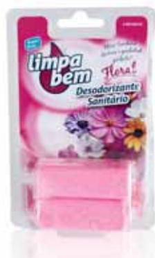
Bloco Sanitário Floral Sanitary Block Floral Bloc Sanitaire Floral Colgador WC Floral

40 gr Un. p/Cx: 1x12 Cód.: 5600441626026