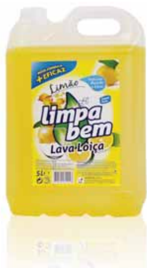
Lava Loiça Limão Lemon Sink Washer Détergent Pour le Vaisselle Citron Lavavajillas Limón

GAMA INDUSTRIAL | INDUSTRIAL RANGE | GAMME INDUSTRIELLE | GAMA INDUSTRIAL