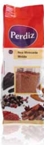
Noz Moscada Moida Milled Nutmeg Noix de Muscade Nuez Moscada Molida