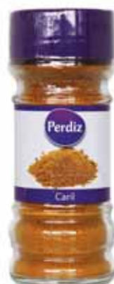
Caril Curry Curry Curry