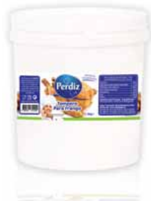
Tempero de Frango Seasoning Garlic with Chicken Assaisonnement pour Poulet Condimento de Pollo

1,2 kg Un. p/Cx: 1x6 Cód.: 5600441612081