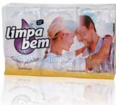
Lenços Papel Kleenex Kleenex Pañuelos de Papel

Pack 6x10 un (3 FIs.) Un. p/Cx: 1x50 Cód.: 35600441628168