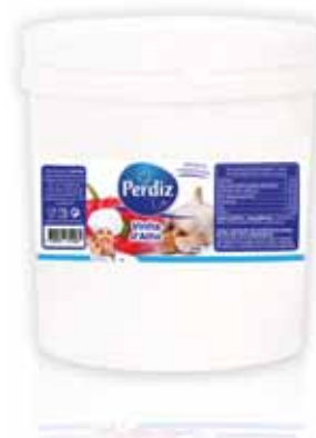
Vinha d'Alho Vineyard Pepper d'Ail Vigne Vinha de Ajo

1,2 kg Un. p/Cx: 1x6 Cód.: 5600441612128