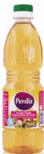
Dupla Fermentação Double Fermentation Double Fermentation Doble Fermentación

500 ml Un. p/Cx: 1x20 Cód.: 5601517161076