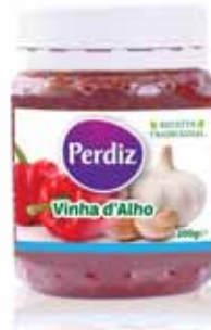
Vinha d'Alho Vineyard Pepper d'Ail Vigne Vinha de Ajo

200 gr Un. p/Cx: 1x12 Cód.: 5600441612111