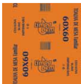
Toalha de Mesa, 1 Folha Paper Tablecloths, 1 Sheet Serviettes en Papier pour Table, 1 Feuille Toalha de Mesa, 1 Hoja

30x45 cm, 1000 un Un. p/Cx: 1x1 Cód.: 5600441628174