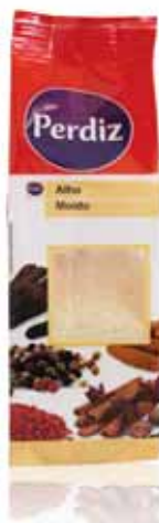
Alho Moído Milled Garlic Épices Ail Écrasé Ajo Molido