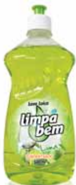
Ultra Concentrado Lima Ultra Concentrate Lime Ultra Concentré Lime Ultra Concentrado Lima

500 ml Un. p/Cx: 1x12 Cód.: 5600441622042