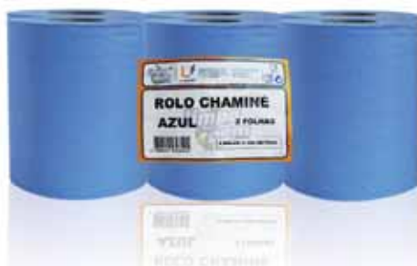
Rolo Chaminé Azul, Folha Dupla Roll Blue Chimney, Double Sheet Rouleau Bleu Cheminée, Double Feuille Rollo Azul Chimenea, Hoja Doble

2 Rolos, 220 mt Un. p/Cx: 1x2 Cód.: 5600441628518