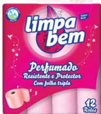
Perfumado (Folha Tripla) Fragrant (Triple Sheet) Parfumé (Feuille Triple) Fragante (Hoja de Triple)

38+10 grátis Un. p/Cx: 1x1 Cód.: 5600441628402