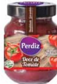
Tomate Tomato Tomate Tomate

340 gr. Un. p/Cx: 1x6 Cód.: 5600441615846