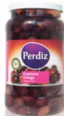
Galega 461/510 Galician 461/510 Galicien 461/510 Gallega 461/510

800 gr Un. p/Cx: 1x6 Cód.: 5600441613194