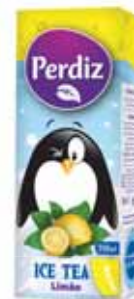
Limão Lemon Citron Limón

200 ml Un. p/Cx: 3x8 Cód.: 5600441617482