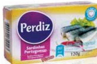
Sardinhas em Óleo Picante Sardines in Spicy Oil Sardines à L'Huile Epicée Sardinas en Aceite Picante

120 gr Un. p/Cx: 1x10 Cód.: 5600441610216