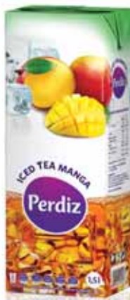
Manga Mango Mangue Manga

1,5 Lt Un. p/Cx: 1x8 Cód.: 5600441617284