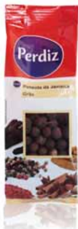
Pimenta da Jamaica Grão Grain Jamaica Pepper Poivre Jamaica Pimienta de Jamaica Grano