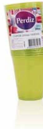
Copos Descartáveis Verdes 200 ml Green Disposable Cups 200 ml Tasses Vert Jetables 200 ml Vasos Desechables Verdes