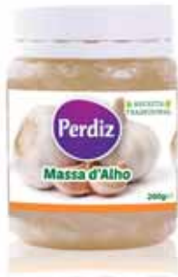
Massa de Alho Garlic Mass Ail Masse Masa de Ajo

200 gr Un. p/Cx: 1x12 Cód.: 5600441612135