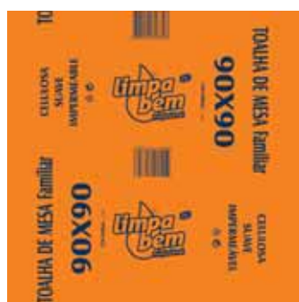
Toalha de Mesa, 1 Folha Paper Tablecloths, 1 Sheet Serviettes en Papier pour Table, 1 Feuille Toalha de Mesa, 1 Folha

80x80 cm, 220 un Un. p/Cx: 1x1 Cód.: 5600441628204