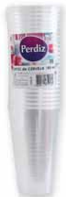
Copos de Cerveja Beer Glasses Verres de Bière Vasos de Cerveza

200 ml, 25 un Un. p/Cx: 10x10 Cód.: 5600441619158