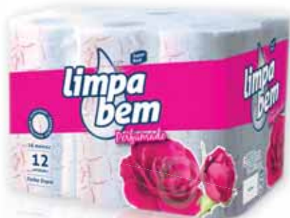
Perfumado (Folha Dupla) Fragrant (Double Sheet) Parfumé (Feuille Double) Fragante (Doble Hoja)

9 rolos Un. p/Cx: 1x8 Cód.: 5600441628396