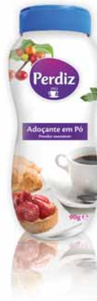
Adoçante em Pó Powder Sweetener Édulcorant Poudre Sacarina Polvo

125 ml Un. p/Cx: 1x24 Cód.: 5600441615907