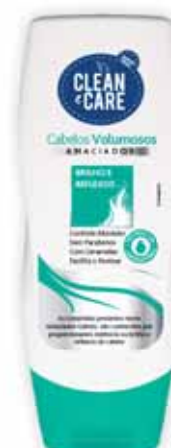
Cabelos Volumosos Voluminous Hair Cheveux Volumineux Cabello Voluminoso

250 ml Un. p/Cx: 1x12 Cód.: 5600441654081