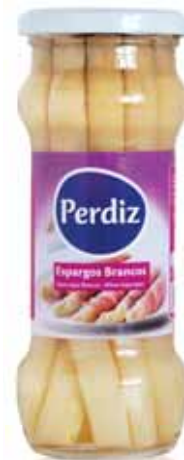
Espargos Brancos White Asparagus Asperges Blanches Espárragos Blancos

370 ml Un. p/Cx: 1x12 Cód.: 5600441610438