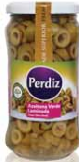
Verde Laminada Green Laminated Vert Feuilleté Verde Laminada

210 gr Un. p/Cx: 1x12 Cód.: 5600441613149