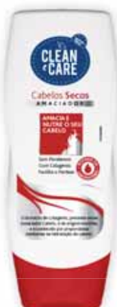
Cabelos Secos Dry Hair Cheveux Secs Cabello Seco

250 ml Un. p/Cx: 1x12 Cód.: 5600441654074