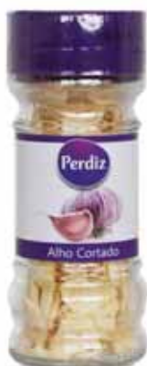
Alho Moído Milled Garlic Épices Ail Écrasé Ajo Cortado