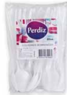
Colheres Sobremesa Dessert Spoons Cuillères à Soupe Cucharas Postre

25 un Un. p/Cx: 10x10 Cód.: 5600441619219