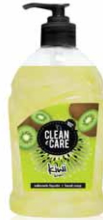
Kiwi Kiwi Kiwi Kiwi

Doseador, 500 ml Un. p/Cx: 1x6 Cód.: 5600441652049