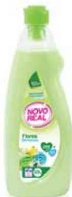
Flores Silvestres Wild Flowers Fleurs Sauvages Flores Silvestres

1,5 Lt Un. p/Cx: 1x9 Cód.: 5600441632133