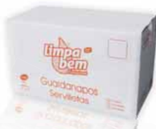
Guardanapos Bar L Napkins Bar L Serviettes Bar L Servilletas Bar L

24x22 cm, 20 maços (3000 un) Un. p/Cx: 20x150 Cód.: 5600441628563