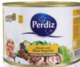
Atum em Óleo Vegetal Tuna in Vegetable Oil Thon à L'huile Végétale Atún en Aceite Vegetal

110 gr Un. p/Cx: 1x100 Cód.: 5600441610773