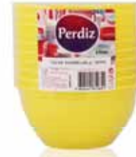
Taças p/Sopa Descartáveis Amarelas Yellow Bowl of Soup Bols pour soupe Jaune Tarro p/Sopa Amarillo