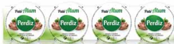
Atum Tuna Thon Atún

Pack 30 Un. p/Cx: 3x10 Cód.: 5600441610766