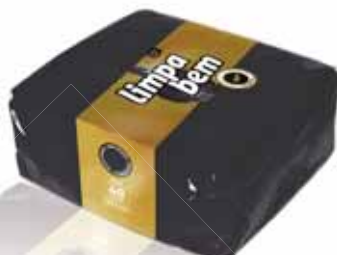
Folha Dupla Preto Black Double Sheet Double Feuille Noir Doble Hoja Negro

40x40 cm, 50 un Un. p/Cx: 1x24 Cód.: 5600441628426