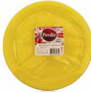
Pratos Refeição Descartáveis Amarelos Yellow Disposable Plates Meal Jaunes Jetables Assiettes Repas Platos Comida Desechables Amarillos

22 cm, 25 un Un. p/Cx: 1x1 Cód.: 5600441619721