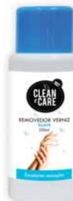
Suave Smooth Suave Suave

250 ml Un. p/Cx: 1x12 Cód.: 5600441650229