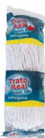
Recarga (Algodão Industrial) Refill (Cotton Industry) Recharge (Industrie Cotonnière) Recarga (Algodón Industrial)