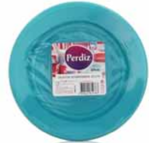
Pratos Sobremesa Descartáveis Azuis Blue Disposable Dessert Plates Dessert Jetables Plaques Bleu Platos Postre Desechables Azules