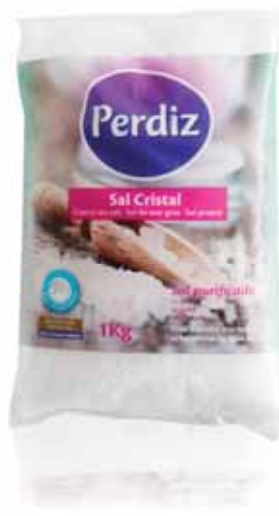
Sal Cristal Square Crystal Cristal de Sel Sal Cristal

Refinado, 250 gr Un. p/Cx: 1x20 Cód.: 5601118000361