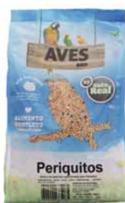
Periquitos Parakeets Perruches Periquitos