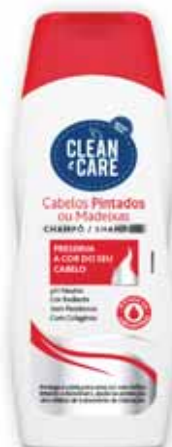
Pintados ou Madeixas Painted or Locks Peint ou Serrures Pintados/Mexas

250 ml Un. p/Cx: 1x12 Cód.: 5600441654043