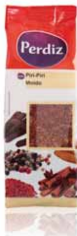
Piri-Piri Moído Milled Piri-piri Piri Piri Piri-Piri Molido