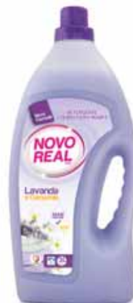
Lavanda e Camomila Lavender and Chamomile Lavande et Camomille Lavanda y Mazanilla

3 Lt, 40 doses Un. p/Cx: 1x5 Cód.: 5600441630047