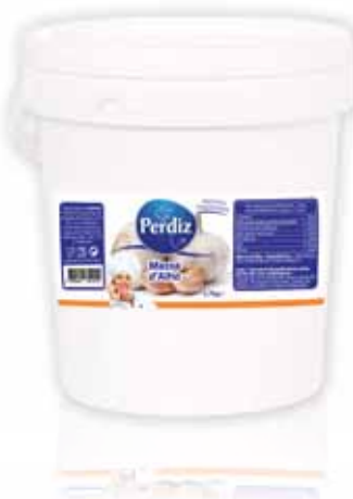
Massa de Alho Garlic Mass Ail Masse Masa de Ajo

1,2 kg Un. p/Cx: 1x6 Cód.: 5600441612104