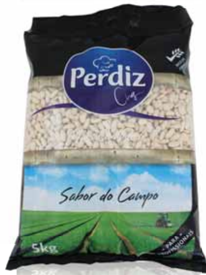
Branco White Blanc Blanco

Seco 5 kg Un. p/Cx: 1x1 Cód.: 5600441610650