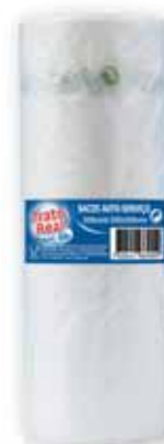
Saco em Rolo Bag on Roll Sac sur Rouleau Bolsa en Rollo

350x450, 500 un Un. p/Cx: 1x10 Cód.: 5600441669030