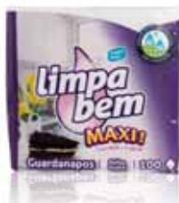
Maxi Folha Dupla Maxi Double Sheet Maxi Double Feuille Maxi Hoja Doble

22x22 cm, 100 un Un. p/Cx: 1x30 Cód.: 5600441628341