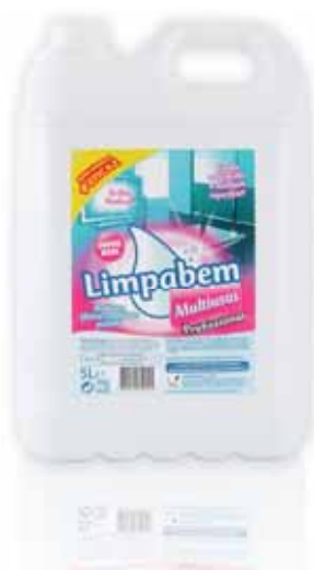
Multiusos Multipurpose Polyvalent Multiuoso