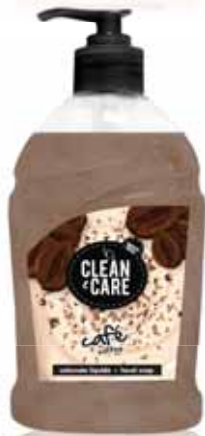
Café Coffee Café Café

Doseador, 500 ml Un. p/Cx: 1x6 Cód.: 5600441652018