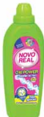
Oxi Power Gel Oxi Power Gel Oxi Power Gel OxiPower Gel

750 ml Un. p/Cx: 2x8 Cód.: 5600441636001