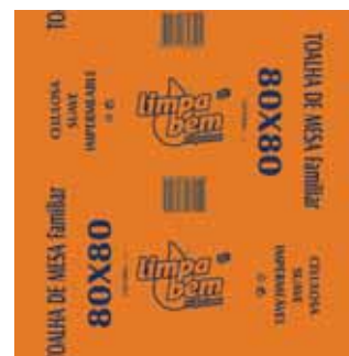
Toalha de Mesa, 1 Folha Paper Tablecloths, 1 Sheet Serviettes en Papier pour Table, 1 Feuille Toalha de Mesa, 1 Folha

75x75 cm, 220 un Un. p/Cx: 1x1 Cód.: 5600441628549