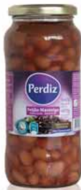
Manteiga Frasco Butter Vial Beurre Bouteille Manteca Frasco

540 gr Un. p/Cx: 1x12 Cód.: 5600441610001