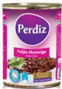
Manteiga Butter Beurre Manteca

Lata 420 gr Un. p/Cx: 1x12 Cód.: 56014743387021