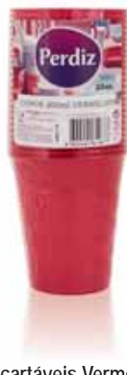
Copos Descartáveis Vermelhos 200 ml Red Disposable Cups 200 ml Tasses Rouge Jetables 200 ml Vasos Desechables Rojos