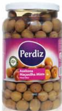
Maçanilha Mista 291/320 Mixed Maçanilha 291/320 Maçanilha Mista 291/320 Maçanilla Mixta 291/320

210 gr Un. p/Cx: 1x12 Cód.: 5600441613118