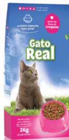
Gato Cat Cat Gato