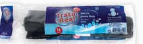
Sacos Lixo Preto Black Garbage Bags Sacs à Ordures Noirs Bolsa Basura

85x105, 6 un Un. p/Cx: 5x10 Cód.: 5600441668026