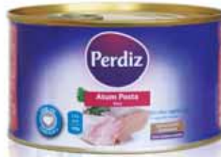
Atum Posta em Óleo Tuna Fish Chop in oil Boîte de Thon Vente à L'Huile Atún Posta en Aceite

110 gr Un. p/Cx: 1x100 Cód.: 5600441610193