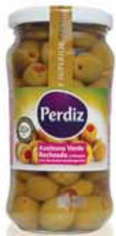
Verde Recheada c/Pimento 301/320 Green Stuffed with Pepper 301/320 Vert Farcies au Piment 301/320 Verde Rellenas c/ Pimento 301/320

220 gr Un. p/Cx: 1x12 Cód.: 5600441613163