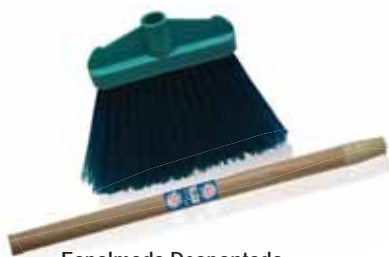
Espalmada Despontada Flattened Broom Balai Aplatie Cepillo Despuntado

Cabo de Madeira Un. p/Cx: 1x6 Cód.: 5600441668132