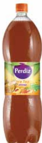
Pêssego Peach Pêche Melocotón

1,5 Lt Un. p/Cx: 1x8 Cód.: 5600441617291