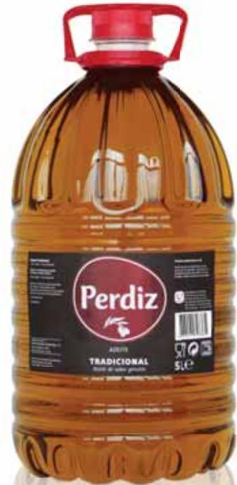
Tradicional Traditional Tradicionnelle Tradicional