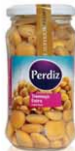
Tremoço Frasco 13/15 Lupin Vial 13/15 Lupin Bouteille 13/15 Altramuz Frasco 13/15

300 gr Un. p/Cx: 1x12 Cód.: 5600441613316