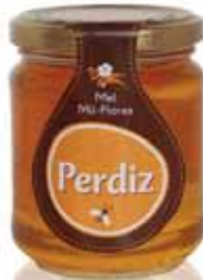
Mil-Flores A Thousand-Flowers Mille - Fleurs Mil Flores

275 gr Un. p/Cx: 1x6 Cód.: 5600441615440