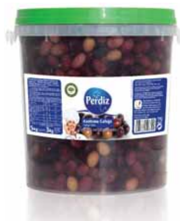
Galega 461/510 Galician 461/510 Galicien 461/510 Gallegas 461/510