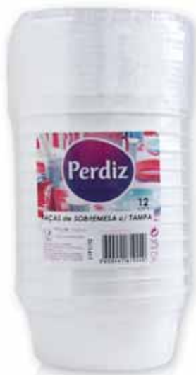
Taças de Sobremesa c/ Tampa Dessert Bowls Bols à Dessert Postre Copas con Tapa

20 cl, 10 un Un. p/Cx: 1x50 Cód.: 5600441619431