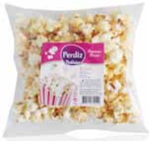
Pipocas Doces Sweet Popcorns Pop-corn Sucré Palomitas Dulces

70 gr Un. p/Cx: 1x16 Cód.: 5600441614542