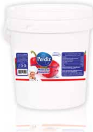
Massa de Pimentão Pepper Mass Poivre Masse Masa de Pimentón

5,7 kg Un. p/Cx: 1x1 Cód.: 5600441612210