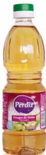
de Vinho Wine Vin de Vino

250 ml Un. p/Cx: 1x15 Cód.: 5601517161106