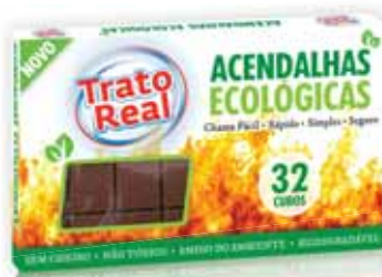
Acendalha Ecológica Ecological Solid Firelighters Solide Allumette Ecologique Pastillas de Encendido Ecológicas

32 un Un. p/Cx: 2x14 Cód.: 5600441667012