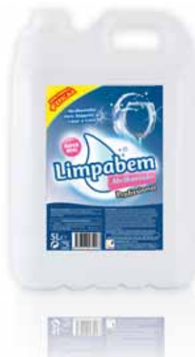
Abrilantador Brightening Brillanteur Abrillantador