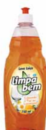
Camomila e Flor de Laranjeira Chamomile and Orange Blossom Camomille et Fleur d'Oranget Mazanilla y Flor de Naranja

750 ml Un. p/Cx: 1x10 Cód.: 5600441622097