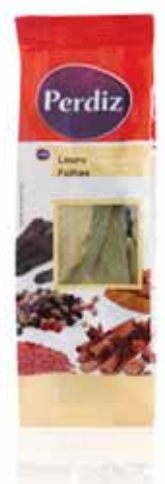
Louro Folhas Laurel Bay Leaf Feuille de Laurier Laurel Hojas