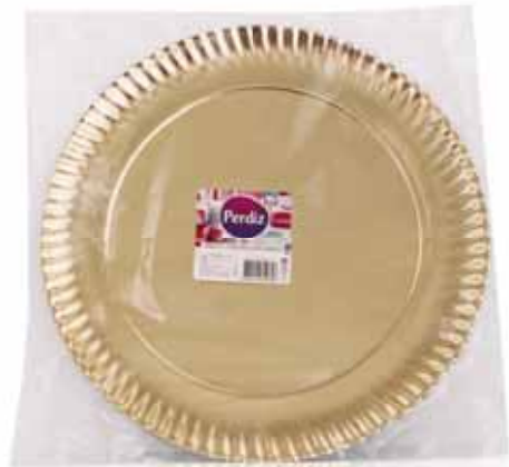
Pratos Redondo Cartão Dishes Round Card Plats de la Carte Ronde Plato Redondo Cartón Dorado

Nº 6 - 1 un Un. p/Cx: 10x10 Cód.: 5600441619660