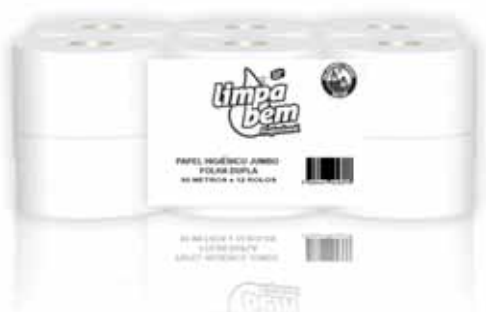
Papel Higiênico Jumbo Green, Folha Dupla Toilet Paper Jumbo Green, Double Sheets Papier de Toilette Vert, Deux Feuille Papel Higiênico Jumbo, Reciclabel, Hoja Doble

1x2, 400 Mt Un. p/Cx: 1x2 Cód.: 5600441628631