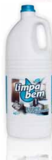
Tradicional Traditional Traditionnel Tradicional