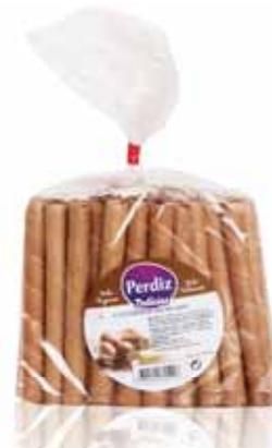
Canudinhos Recheados Cabudinhos Covered Cabudinhos Enrobées Barquillos Rellenos

300 gr Un. p/Cx: 1x12 Cód.: 5600441615433