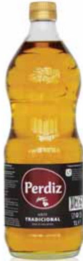
Tradicional Traditional Tradicionnelle Tradicional

0,75 Lt Un. p/Cx: 1x12 Cód.: 5600441614115