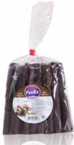
Canudinhos Cobertos de Chocolate Cabudinhos Covered Chocolate Cabudinhos Enrobées de Chocolat Barquillos Cubiertos Chocolate

300 gr Un. p/Cx: 1x20 Cód.: 5600441615419