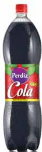
Cola Coke Colle Cola

1,5 Lt Un. p/Cx: 1x6 Cód.: 5600441617673