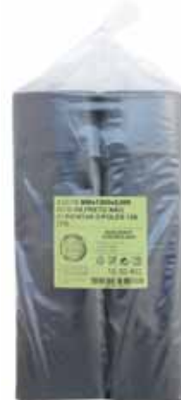
Saco Lixo Baixa Densidade Low Density Garbage Bag Sac à Ordures en Faible Densité Bolsa Basura Baja Densidad

950x1200, 10 kg Un. p/Cx: 1x10 Cód.: 5600441668286