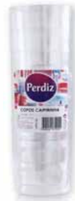
Copos Caipirinha Caipirinha Drinkware Verres pour Caipirinha Vasos para Caipirinha

50 un Un. p/Cx: 10x20 Cód.: 5600441619134