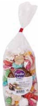
Beijinhos Kisses Baisers Besitos

150 gr Un. p/Cx: 1x12 Cód.: 5600441615372