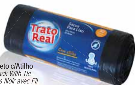
Sacos Lixo Preto c/Atilho Trash Bags Black With Tie Sacs à Ordures Noir avec Fil Bolsa Basura Negra c/Cierre

50x65, 30Lt, 40 un Un. p/Cx: 6x5 Cód.: 5600441668453