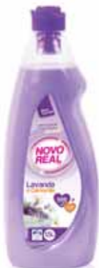
Lavanda e Camomila Lavender and Chamomile Lavande et Camomille Lavanda y Mazanilla

1,5 Lt Un. p/Cx: 1x9 Cód.: 5600441632171