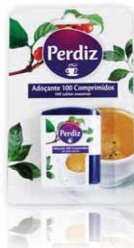
Adoçante Doseador Sweetener Dispenser Édulcorant Distributeur Sacarina Dosificador

250 Saquetas Un. p/Cx: 1x34 Cód.: 5600441615723