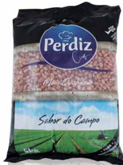
Catarino Catarino Catarino Catarino

Seco 5 kg Un. p/Cx: 1x1 Cód.: 5600441610629