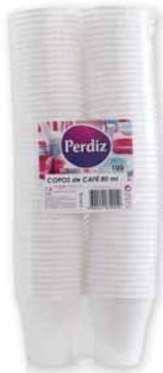
Copos de Café Coffee Glasses Tasses à Café Vasos p/Café

12 un Un. p/Cx: 1x25 Cód.: 5600441619400