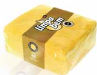
Folha Dupla Amarelo Yellow Double Sheet Double Feuille Jaune Doble Hoja Amarillo

40x40 cm, 40 un Un. p/Cx: 1x24 Cód.: 5600441628105