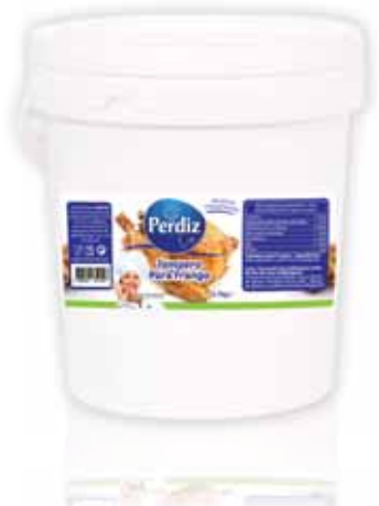
Tempero de Frango Seasoning Garlic with Chicken Assaisonnement pour Poulet Condimento de Pollo

5,7 kg Un. p/Cx: 1x1 Cód.: 5600441612180