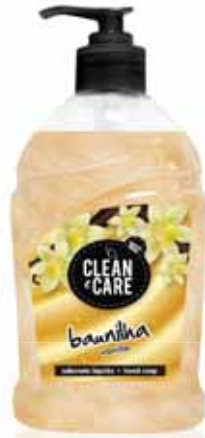
Baunilha Vanilla Vanille Vainilla

Doseador, 500 ml Un. p/Cx: 1x6 Cód.: 5600441652001