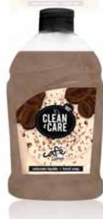
Café Coffee Café Café

Doseador, 500 ml Un. p/Cx: 1x6 Cód.: 5600441652070