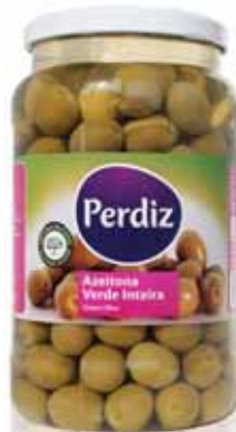
Verde Inteira 181/200 Entire Green 181/200 Hertes 181/200 Verde Entera 181/200

800 gr Un. p/Cx: 1x6 Cód.: 5600441613255