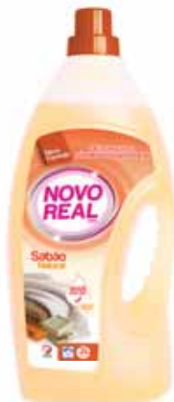
Sabão Natural Natural Soap Savon Naturel Jabón Natural

3 Lt, 40 doses Un. p/Cx: 1x5 Cód.: 5600441630009