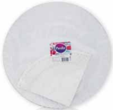
Pratos Cartão c/ Naperon Dishes Card with Naperon Carte avec des Plats Naperon Platos Cartón c/Napperon

Nº 7 - 1 un Un. p/Cx: 10x10 Cód.: 5600441619585