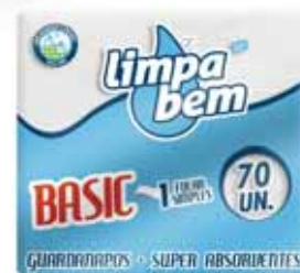
Basic Folha Simples Basic Simple Sheet Feuille Simple de Base Basic Hoja Simples

33x33 cm, 70 un Un. p/Cx: 1x30 Cód.: 5600441628037