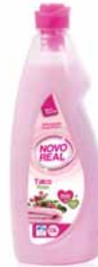
Talco Rosa Talc Pink Talc Rose Talco Rosa

1,5 Lt Un. p/Cx: 1x9 Cód.: 5600441632058