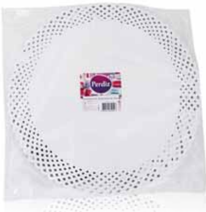
Naperons Redondos Round Doilies Napperons Ronds Napperons Redondos

32 cm - 1 un Un. p/Cx: 10x10 Cód.: 5600441619653