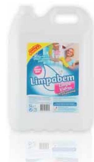
Limpa Vidros Glass Cleaner Détergent de Vitre Limpiacristales