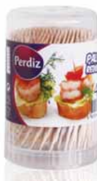
Paliteiro Redondo Round Toothpick Dispenser Porte Cure-Dents Rond Palillero Redondo

120 un Un. p/Cx: 24x12 Cód.: 5600441619080