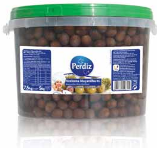
Maçanilha RG 291/320 Maçanilha RG 291/320 Maçanilha RG 291/320 Maçanilla RG 291/320