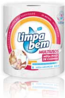
Multiusos Mega XXL Multipurpose Mega XXL Mega polyvalente XXL Multiusos Mega XXL

1 un (50 mt.) Un. p/Cx: 1x6 Cód.: 5600441628372