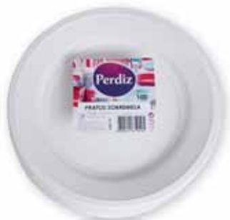
Pratos Sobremesa Dessert Plates Assiettes à Dessert Platos Postre

100 un Un. p/Cx: 1x1 Cód.: 5600441619295