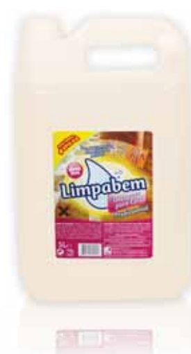
Decapante Ceras Wax Stripper Décapant Cires Decapante Ceras