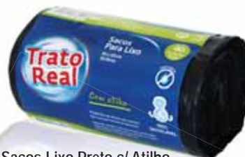
Sacos Lixo Preto c/ Atilho Trash Bags Black With Tie Sacs à Ordures Noir avec Fil Bolsa Basura Negra c/Cierre

55x55, 30Lt, 15 un Un. p/Cx: 5x10 Cód.: 5600441668446