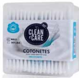
Cotonetes Swabs Écouvillons Bastoncillos

100 un Un. p/Cx: 6x12 Cód.: 5600441651080