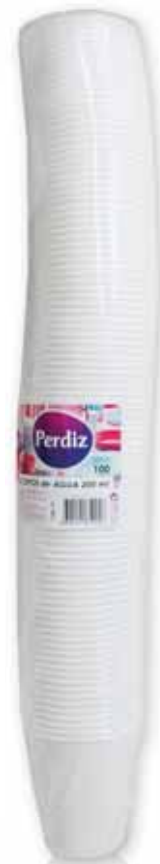
Copos de Água Water Glasses Verres d'Eau Vasos de Agua

80 ml, 100 un Un. p/Cx: 1x1 Cód.: 5600441619240