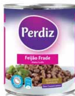
Frade Black - Eyed Niébé Pintas

Lata 820 gr Un. p/Cx: 1x12 Cód.: 5601474386017