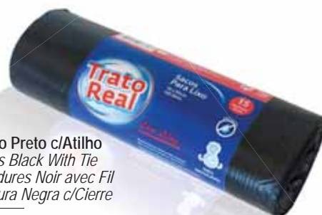
Sacos Lixo Preto c/Atilho Trash Bags Black With Tie Sacs à Ordures Noir avec Fil Bolsa Basura Negra c/Cierre

65x75, 50Lt, 30 un Un. p/Cx: 6x5 Cód.: 5600441668460