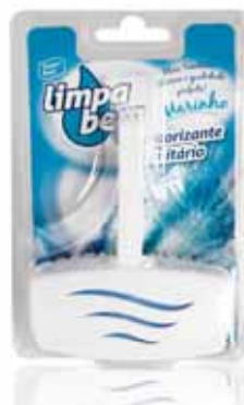
Bloco Sanitário Marinho Sanitary Block Marine Bloc Sanitaire Marin Colgador WC Marinho

40 gr Un. p/Cx: 1x12 Cód.: 5600441626002