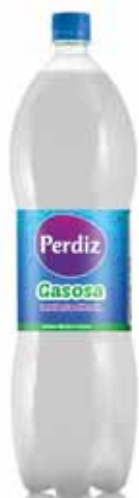
Gasosa Soda Limonade Gazeuse Gaseosa

1,5 Lt Un. p/Cx: 1x6 Cód.: 5600441617666