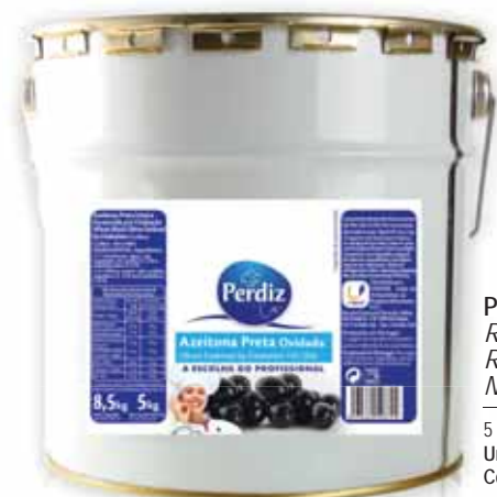
Preta Oxidada 181/200 Rusty Black 181/200 Rusty Noire 181/200 Negra Oxidada 181/200