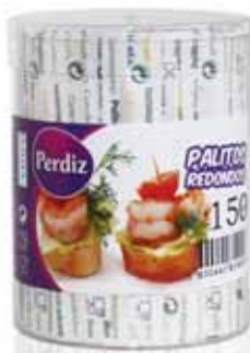
Paliteiro Individuais Individual Toothpick Dispenser Cure-Dents Individuels Palillos Individuales

400 un Un. p/Cx: 12x12 Cód.: 5600441619073