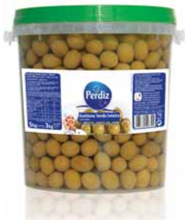
Verde Inteira 181/200 Entire Green 181/200 Hertes 181/200 Verde Entera 181/200