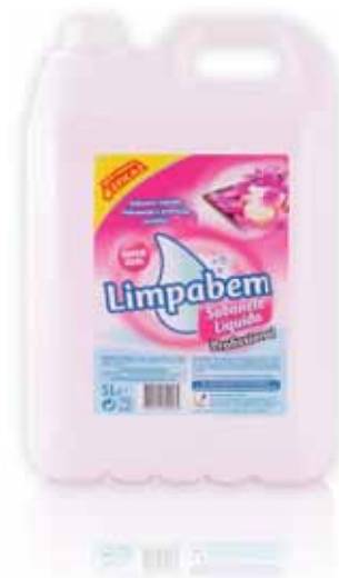
Sabonete Líquido Rosa Mãos Hand Liquid Soap Pink Savon Liquid Rose Mains Jabón Líquido Rosa Manos