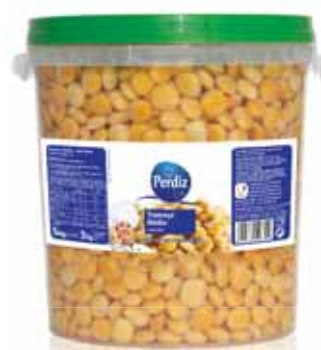
Tremoço Médio Balde 11 Medium Lupin Bucket 11 Lupin Moyen Seau 11 Altramuz Mediano Balde 11