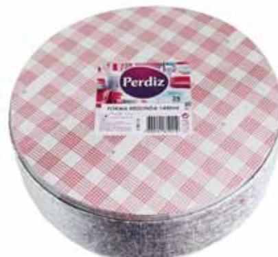
Forma Redonda Round Form Formes Tour Forma Redonda

2200 ml - 25 un Un. p/Cx: 1x12 Cód.: 5600441619332