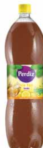
Limão Lemon Citron Limón