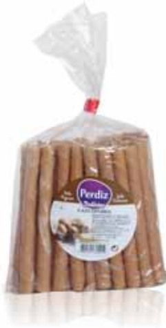
Canudinhos Cabudinhos Cabudinhos Barquillos

250 gr Un. p/Cx: 1x12 Cód.: 5600441615396