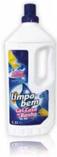
Gel Casa de Banho Bathroom Gel Gel Salle de Bain Gel de Baño WC

750 ml Un. p/Cx: 1x24 Cód.: 5600441623100