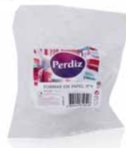
Formas de Papel p/ Queques Forms of Paper for Cupcakes Les Formes de Papier pour Cupcakes Formas de Papel p/Queques

Nº 3 - 100 un Un. p/Cx: 10x10 Cód.: 5600441619509