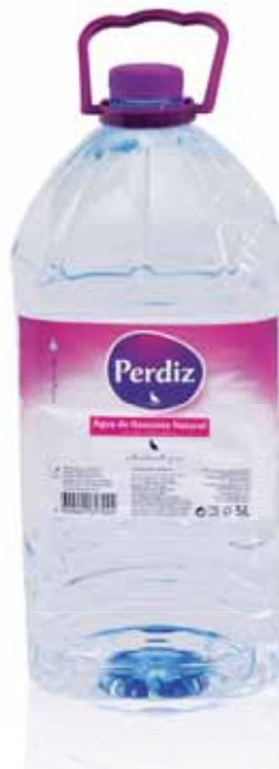
Água de Nascente Spring Water L'eau de Source Agua de Manantial

1,5 Lt, PACK 6 Un. p/Cx: 1x6 Cód.: 5600441617017