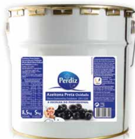
Preta Oxidada 291/320 Rusty Black 291/320 Rusty Noire 291/320 Negra Oxidada 291/320