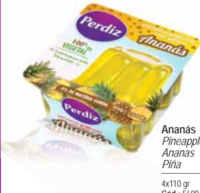
Ananás Pineapple Ananas Piña

SOBREMESA GELIFICADA | DESSERTS | DESSERTS | SOBREMESA GELIFICADA