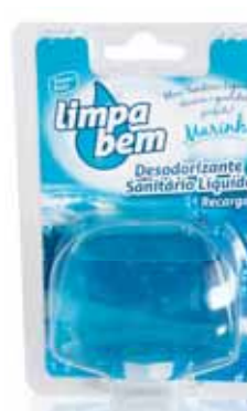
Bloco Sanitário Marinho Sanitary Block Marine Bloc Sanitaire Marin Colgador WC Marinho

Líquido Un. p/Cx: 1x12 Cód.: 5600441626095