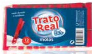
Molas Roupá Plástico Spring Plastic Clothing Pincés à Linge Pinzas Ropa Plástico

12 un Un. p/Cx: 24x12 Cód.: 5600441668293