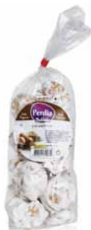
Cavaquinhas Cavaquinhas Gâteau d'Arachide Cavaquinhas

300 gr Un. p/Cx: 1x12 Cód.: 5600441615532