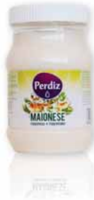
Maionese Mayonnaise Mayonnaise Mayonesa

225 ml Un. p/Cx: 1x6 Cód.: 5600441612647