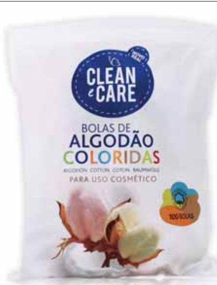
Bolas de Algodão Coloridas Colorful Cotton Balls Boules de Coton Colorées Bolas de Algodón Colores

100 gr Un. p/Cx: 8x10 Cód.: 5600441651158