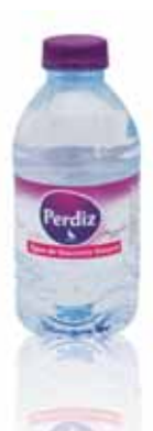
Água de Nascente Spring Water L'eau de Source Agua de Manantial

0,33 Lt, PACK 24 Un. p/Cx: 1x24 Cód.: 5600441617000