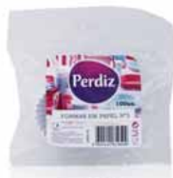
Formas de Papel p/ Queques Forms of Paper for Cupcakes Les Formes de Papier pour Cupcakes Formas de Papel p/Queques

Nº 2 - 100 un Un. p/Cx: 10x10 Cód.: 5600441619493