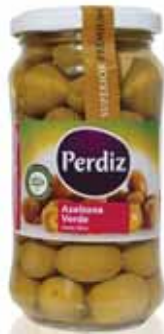
Verde 181/200 Green 181/200 Vert 181/200 Verde 181/200

220 gr Un. p/Cx: 1x12 Cód.: 5600441613163