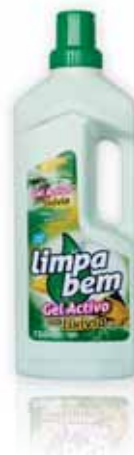
Gel Activo com Lixívia Active Leaches Gel Gel Actif avec Lessive Gel Activo con Lejía

750 ml Un. p/Cx: 1x24 Cód.: 5600441623124