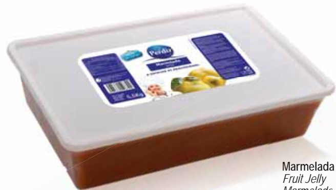
Marmelada Fruit Jelly Marmelade Mermelada

450 gr Un. p/Cx: 1x12 Cód.: 5600441615037