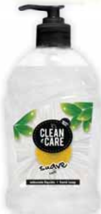
Suave Smooth Suave Suave

Doseador, 500 ml Un. p/Cx: 1x6 Cód.: 5600441652056