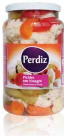
Pickles Frasco Pickles Vial Bouteille de Pickles Encurtidos Frasco

380 gr Un. p/Cx: 1x12 Cód.: 5600441613279