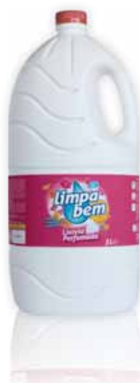
Perfumada Perfumed Parfumé Perfumada