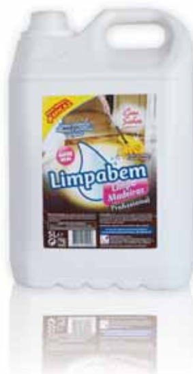
Limpa Madeiras com Sabão Wood Cleaning with Soap Lavage de Bois avec Savon Limpia Maderas con Jabón