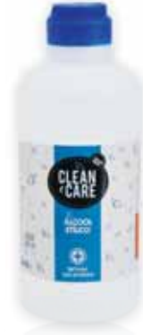
Álcool Etilico 96° Ethyl Alcohol 96° L'alcool Éthylique Alcohol Etilico 96°

500 ml Un. p/Cx: 1x12 Cód.: 5600441650038