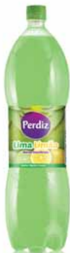
Lima-Limão Lemon-Lime Citron-Lime Lima-Limón

1,5 Lt Un. p/Cx: 1x6 Cód.: 5600441617666