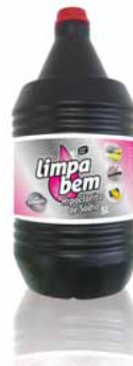
Hipoclorito de Sódio Sodium Hypochlorite Hypochlorite de Sodium Hipoclorito de Sodio