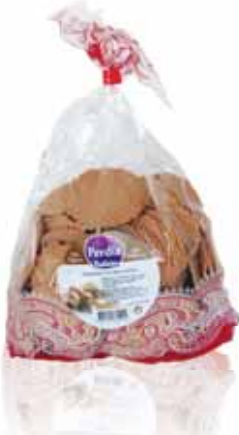
Redonditas Crocantes Redonditas Crocantes Redonditas Crocantes Redonditas Crocantes

250 gr Un. p/Cx: 1x14 Cód.: 5600441615402