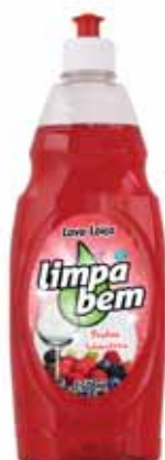
Frutos Silvestres Berries Baies Frutos del Bosque

750 ml Un. p/Cx: 1x10 Cód.: 5600441622080