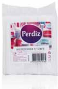
Palhetas Indiv. para Café Individual Vanes for Coffee Rouseaux por le Café Paletas Indiv. para Café

100 un Un. p/Cx: 10x10 Cód.: 5600441619134