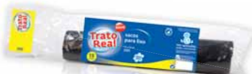
Sacos Lixo c/ Fecho Preto Scented Trash Bags with Black Buckle Sacs à Ordures Parfumées avec Noire Boucle Bolsa Basura Cierre Negra

55x55, 30 Lt, 15 un Un. p/Cx: 5x10 Cód.: 5600441668002