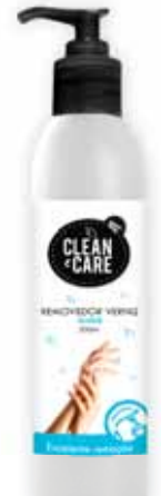
Removedor c/Doseador Remover with Dispenser Dissolvant avec Dosage Quitaesmaltes c/ Dosificador

125 ml Un. p/Cx: 1x6 Cód.: 5600441650069