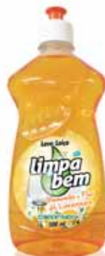
Ultra Concentrado Camomila e Flor de Laranjeira Ultra Concentrate Chamomile and Orange Blossom Ultra Concentré Camomille et Fleur d'Oranger Ultra Concentrado Mazanilla y Flor de Naranja

500 ml Un. p/Cx: 1x12 Cód.: 5600441622110