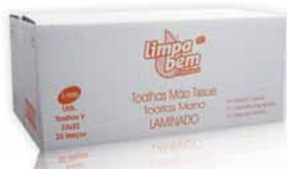
Toalhas Mão Tissue Laminado Paper Hand Towels Tissue Laminated Serviettes en Papier pour le Main Tissues Feuilleté Toallas de Mano Tissue Laminado

21x23 cm, 20 maços (2800 un) Un. p/Cx: 20x130 Cód.: 5600441628136