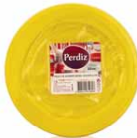
Pratos Sobremesa Descartáveis Amarelos Yellow Disposable Dessert Plates Dessert Jetables Plaques Jaune Platos Postre Desechables Amarillos