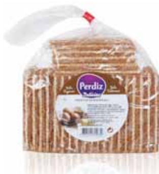
Delicias Baunilha Vanilla Delights Plaisirs de Vanille Delicias de Vainilla

300 gr Un. p/Cx: 1x12 Cód.: 5600441615426