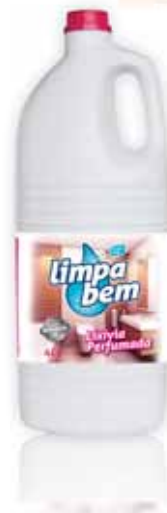
Perfumada Perfumed Parfumé Perfumada