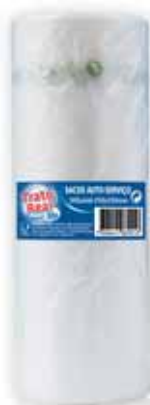
Saco em Rolo Bag on Roll Sac sur Rouleau Bolsa en Rollo

250x350, 500 un Un. p/Cx: 1x10 Cód.: 5600441669016