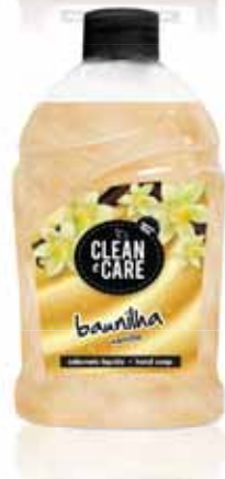
Baunilha Vanilla Vanille Vainilla

Recarga, 500 ml Un. p/Cx: 1x6 Cód.: 5600441652063