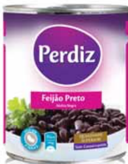
Preto Black Noir Negro

Lata 820 gr Un. p/Cx: 1x12 Cód.: 5601474386000