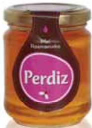
Rosmaninho Rosemary Romarin Romero

275 gr Un. p/Cx: 1x6 Cód.: 5600441615440