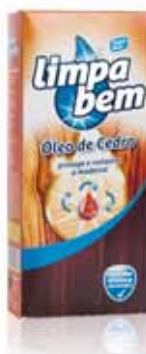
Óleo de Cedro Cedar Oil Huile de Cèdre Aceite de Cedro

300 ml Un. p/Cx: 1x12 Cód.: 5600441624107