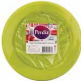
Pratos Sobremesa Descartáveis Verdes Green Disposable Dessert Plates Dessert Jetables Plaques Vert Platos Postre Desechables Verdes