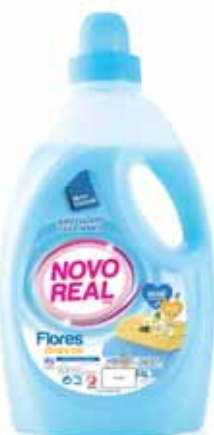
Flores Brancas White Flowers Fleurs Blanches Flores Blancas