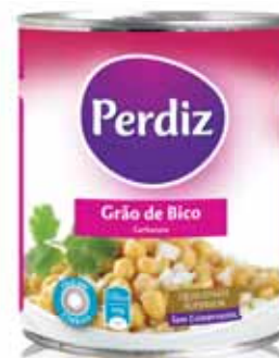
Grão de Bico Chickpeas Pois Chique Garbanzo

Lata 820 gr Un. p/Cx: 1x12 Cód.: 5600441610124