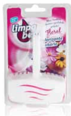
Bloco Sanitário Floral Sanitary Block Floral Bloc Sanitaire Floral Colgador WC Floral

40 gr Un. p/Cx: 1x12 Cód.: 5600441626033