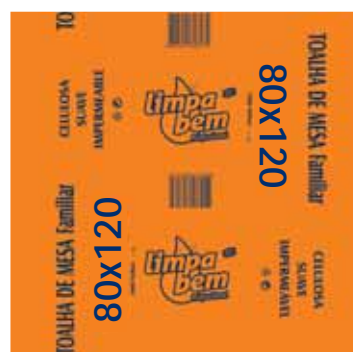
Toalha de Mesa, 1 Folha Paper Tablecloths, 1 Sheet Serviettes en Papier pour Table, 1 Feuille Toalha de Mesa, 1 Folha

90x90 cm, 220 un Un. p/Cx: 1x1 Cód.: 5600441628303