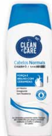
Cabelos Normais Normal Hair Cheveux Normaux Cabello Normal

250 ml Un. p/Cx: 1x12 Cód.: 5600441654029