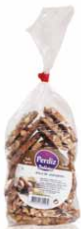
Bolo de Amendoim Peanut Cake Gâteau d'Arachide Bolo de Cacahuete

300 gr Un. p/Cx: 1x12 Cód.: 5600441615532