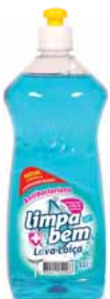
Antibacteriano Anti-Bacterial Anti-Bactérien Antibacteriano

750 ml Un. p/Cx: 1x10 Cód.: 5600441622073