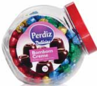
Creme Cream Crème Crema

Frasco Vidro kg Un. p/Cx: 1x6 Cód.: 5600441615075