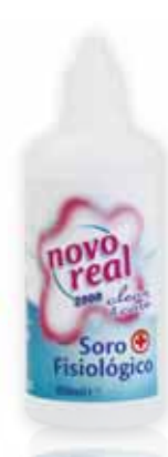
Soro Fisiológico Physiological Serum Saline Suero Fisiológico

250 ml Un. p/Cx: 1x12 Cód.: 5600441650243