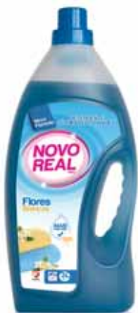
Flores Brancas White Flowers Fleurs Blanches Flores Blancas

3 Lt, 40 doses Un. p/Cx: 1x5 Cód.: 5600441630016