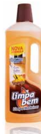
Limpa Madeiras com Sabão Clean Wood with Soap Mobiliere Nettoyage avec Savon Limpia Muebles con Jabón

750 ml Un. p/Cx: 2x9 Cód.: 5600441624008