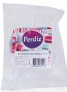
Formas de Papel p/ Queques Forms of Paper for Cupcakes Les Formes de Papier pour Cupcakes Formas de Papel p/Queques

Nº 4 - 100 un Un. p/Cx: 10x10 Cód.: 5600441619516