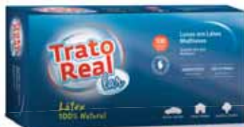
Látex Multiusos Multipurpose Latex Latex à Usages Multiples Látex Multiusos

100 un, Tam L Un. p/Cx: 1x10 Cód.: 5600441665032