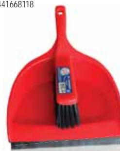
Pá + Espanador Shovel + Mop Pelle + Ensemble de Balai Recogedor + Cepillo

Plástico (Azul e Vermelha) Un. p/Cx: 1x12 Cód.: 5600441668101