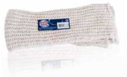
Pano de Malha 100% Algodão mesh Cloth 100% Cotton Tissu Maille 100% Coton Paño de Malla

42+42 Un. p/Cx: 12x12 Cód.: 5600441668330