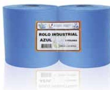
Rolo Industrial Azul, Folha Dupla Industrial Roll Blue, Double Sheet Industrielle Rouleau Bleu, Double Feuille Rollo Industrial Azul, de Hoja Doble

2 Rolos, 130 mt Un. p/Cx: 1x2 Cód.: 5600441628501