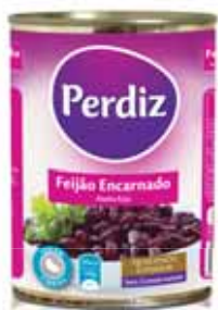
Encarnado Red Rouges Encarnado

Lata 420 gr Un. p/Cx: 1x12 Cód.: 56014743387021