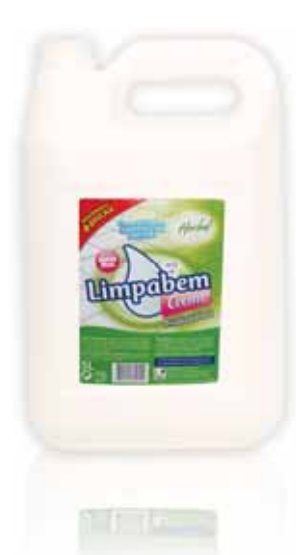
Creme WC Herbal Cream Herbal WC Crème WC Herbal Crema WC Herbal