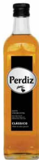
Clássico Virgem Extra Classic Extra Virgin Extra Vierge Classique Virgen Extra Clásico

0,25 Lt Un. p/Cx: 1x12 Cód.: 5600441614153