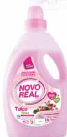
Talco Rosa Talc Pink Talc Rose Talco Rosa

1,5 Lt Un. p/Cx: 1x3 Cód.: 5600441632102