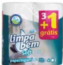
Soft (Folha Dupla) Soft (Double Sheet) Soft (Feuille Double) Soft (Doble Hoja)

24+8 grátis Un. p/Cx: 1x1 Cód.: 5600441628297