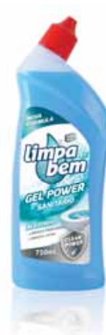
Gel Sanitário Marinho Sanitary Marine Gel Gel Sanitaire Marin Gel Sanitário de Baño Marino

750 ml Un. p/Cx: 1x9 Cód.: 5600441623056