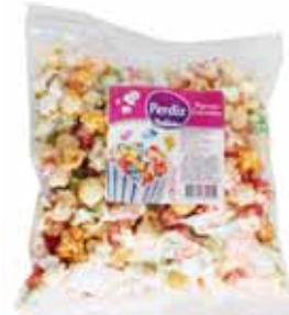
Pipocas Coloridas Coloured Popcorn Pop-corn Coloré Palomitas de Colores

70 gr Un. p/Cx: 1x16 Cód.: 5600441614566