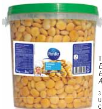
Tremoço Extra Balde 13/15 Extra Lupin Bucket 13/15 Extra Lupin Seau 13/15 Altramuz Extra Balde 13/15

800 gr Un. p/Cx: 1x6 Cód.: 5600441613323