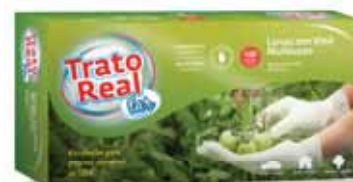
Vinil Multiusos Vinyl Multipurpose Vinyle Multi-Usages Vinilo Multiusos

100 un, Tam M Un. p/Cx: 1x10 Cód.: 5600441665056