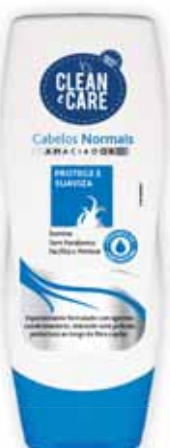
Cabelos Normais Normal Hair Cheveux Normaux Cabello Normal

250 ml Un. p/Cx: 1x12 Cód.: 5600441654074