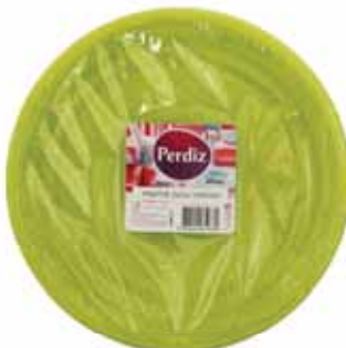
Pratos Refeição Descartáveis Verdes Green Disposable Plates Meal Vert Jetables Assiettes Repas Platos Comida Desechables Verdes

22 cm, 25 un Un. p/Cx: 1x1 Cód.: 5600441619738