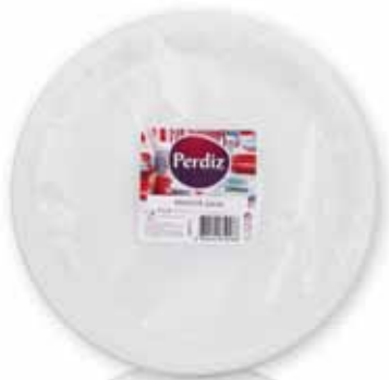
Pratos Refeição 22 cm Meal Dishes 22 cm Plats du Repas 22 cm Platos Comida 22 cm

22 cm, 100 un Un. p/Cx: 1x8 Cód.: 5600441619486