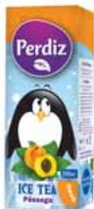
Pêssego Peach Pêche Melocotón

200 ml Un. p/Cx: 3x8 Cód.: 5600441617499