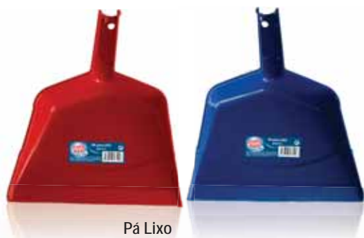
Pá Lixo Garbage Shovel Pelle à Poussière Recogedor Basura

Plástico (Azul e Vermelha) Un. p/Cx: 1x12 Cód.: 5600441668101