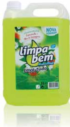
Lava-tudo Camomila e Flor de Laranjeira Purpose Cleaners Camomile and Orange Blossom Nettoyants Tout Floral Camomille et Orange Blossom Limpiador Mazanilla y Flor de Naranja