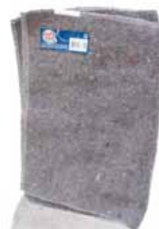
Pano Chão Floor Cloth Serpillère Paño Suelo

40x60, 80% Algodão Un. p/Cx: 1x12 Cód.: 5600441668392