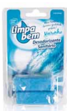
Bloco Sanitário Marinho Sanitary Block Marine Bloc Sanitaire Marin Colgador WC Marinho

Recarga, 2x40 gr Un. p/Cx: 1x12 Cód.: 5600441626040