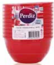
Taças p/Sopa Descartáveis Vermelhas Red Bowl of Soup Bols pour soupe Rouge Tarro p/Sopa Rojo