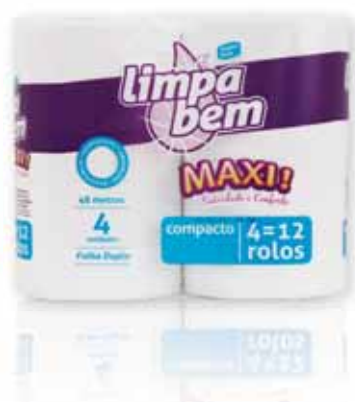
Maxi (Folha Dupla) Maxi (Double Sheet) Maxi (Feuille Double) Maxi (Doble Hoja)

4=12 rolos Un. p/Cx: 1x15 Cód.: 5600441628365