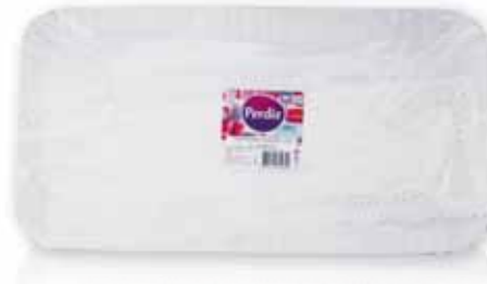
Travessa Cartão c/ Naperon Card Platter with Naperon Carte Plateau avec Naperon Bandeja Cartón c/Napperon

Nº 5 - 1 un Un. p/Cx: 10x10 Cód.: 5600441619615