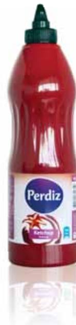
Ketchup Ketchup Ketchup Ketchup

500 gr Un. p/Cx: 1x6 Cód.: 5600441612302