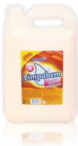
Cera Madeiras Wax Wood Cire pour Bois Cera Maderas