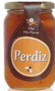
Mil-Flores A Thousand-Flowers Mille - Fleurs Mil Flores

275 gr Un. p/Cx: 1x6 Cód.: 5600441615464