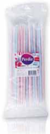
Palhinhas Indiv. Listadas Individual Listed Straws Pailles Colorées Individuel Pajitas Individuales Rayas

50 un Un. p/Cx: 10x20 Cód.: 5600441619042