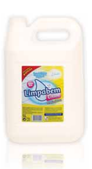
Creme WC Limão Cream Lemon WC Crème WC Citron Crema WC Limón