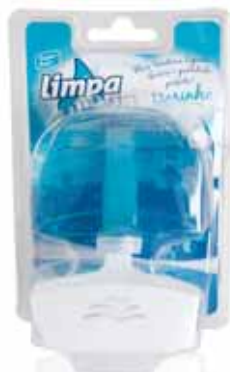
Bloco Sanitário Marinho Sanitary Block Marine Bloc Sanitaire Marin Colgador WC Marinho

Recarga, 2x40 gr Un. p/Cx: 1x12 Cód.: 5600441626064