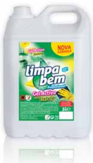
Gel Activo com Lixívia Active Gel with Bleach Gel Actif avec Lessive Gel Activo con Lejía