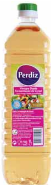
Dupla Fermentação Double Fermentation Double Fermentation Doble Fermentación

750 ml Un. p/Cx: 1x20 Cód.: 5601517161083