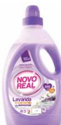
Lavanda e Camomila Lavender and Chamomile Lavande et Camomille Lavanda y Mazanilla