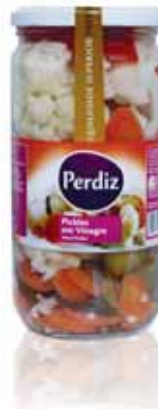
Pickles Frasco Pickles Vial Bouteille de Pickles Encurtidos Frasco

180 gr Un. p/Cx: 1x12 Cód.: 5600441613262