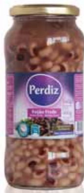
Frade Frasco Black - Eyed Vial Niébè Bouteille Pintas Frasco

540 gr Un. p/Cx: 1x12 Cód.: 5600441610001