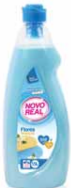
Flores Brancas White Flowers Fleurs Blanches Flores Blancas

1,5 Lt Un. p/Cx: 1x9 Cód.: 5600441632171