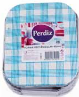
Forma Rectângular Rectangular Form Forme de Rectangulaire Forma Rectangular

450 ml - 25 un Un. p/Cx: 1x25 Cód.: 5600441619301