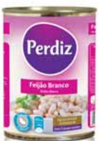
Branco White Blanc Blanco

Lata 420 gr Un. p/Cx: 1x12 Cód.: 5601474387038