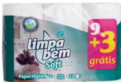
Soft (Folha Dupla) Soft (Double Sheet) Soft (Feuille Double) Soft (Doble Hoja)

3+1 grátis Un. p/Cx: 1x27 Cód.: 5600441628006