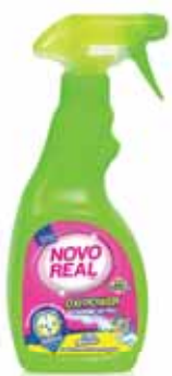
Oxi Power Pré-Lavagem Oxi Power Pre Wash Oxi Power Prélavage OxiPower Pre-Lavado

500 ml Un. p/Cx: 3x8 Cód.: 5600441636025