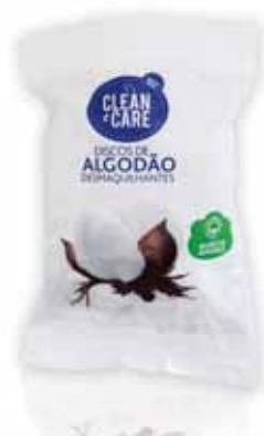
Discos Algodão Desmaquilhantes Cotton Makeup Removers Discs Dècapants Coton de Maquillage Disques Discos Algodón Desmaquillantes

100 un Un. p/Cx: 8x10 Cód.: 5600441651134