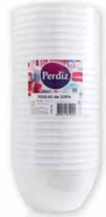
Tigela de Sopa Soup Mixing Bowl Bol de Soupe Bol de Sopa

25 un Un. p/Cx: 10x10 Cód.: 5600441619462