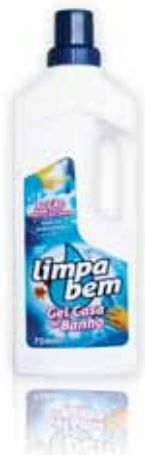
Gel Casa de Banho Bathroom Gel Gel Salle de Bain Gel de Baño WC

750 ml Un. p/Cx: 1x24 Cód.: 5600441623124