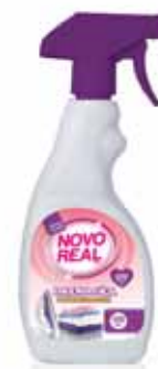
Engoma Fácil Easy Ironing Repassage Plus Facile Engoma Fácil

Água Perfumada, 1 Lt Un. p/Cx: 1x12 Cód.: 5600441634007