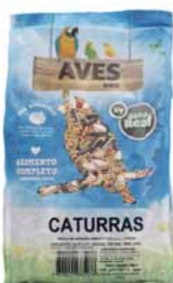
Caturras Cockatiels Calopsittes Caturras

750 gr Un. p/Cx: 1x12 Cód.: 5600441685054