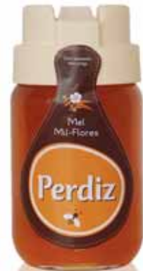
Mil-Flores A Thousand-Flowers Mille - Fleurs Mil Flores

480 gr Un. p/Cx: 1x6 Cód.: 5600441615471