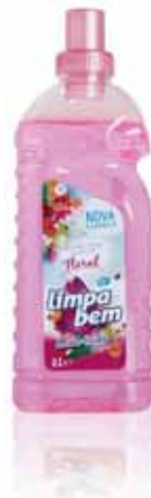
Floral Floral Floral