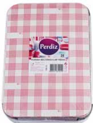
Forma Rectângular Rectangular Form Forme de Rectangulaire Forma Rectangular

750 ml - 25 un Un. p/Cx: 1x20 Cód.: 5600441619349