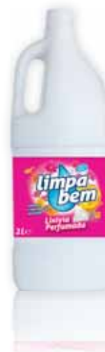
Perfumada Perfumed Parfumé Perfumada