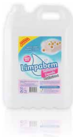
Sabonete Líquido Branco Mãos Hand Liquid Soap White Savon Liquid Blanc Mains Jabón Líquido Blanco Manos