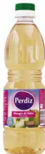
Sidra (plástico) Cider (plastic) Cidre (plastique) Sidra (plástico)

500 ml Un. p/Cx: 1x20 Cód.: 5601517161113