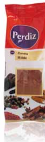
Canela Moída Ground Cinnamon Cannelle Moulu Canela Molida