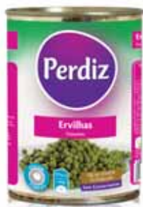
Ervilhas Peas Pois Guisantes

420 gr Un. p/Cx: 1x12 Cód.: 5601474387052