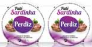
Sardinha Sardine Sardine Sardina

Pack 4 Un. p/Cx: 4x6 Cód.: 5600441610766