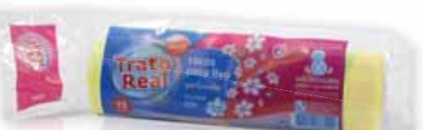
Sacos Lixo Perfumados c/ Fecho Amarelo Scented Trash Bags with Yellow Buckle Sacs à Ordures Parfumées avec Jaune Boucle Bolsa Basura Perfumada Cierre Amarillo

55x55, 30 Lt, 15 un Un. p/Cx: 5x10 Cód.: 5600441668163