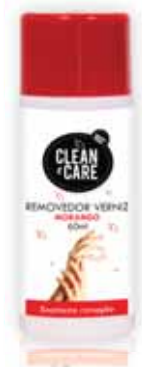
Morango Strawberry Fraise Fresa

60 ml Un. p/Cx: 1x12 Cód.: 5600441650076