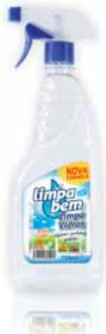
Limpa Vidros Glass Cleaner Détergent de Vitre Limpia Cristales

500 ml Un. p/Cx: 1x12 Cód.: 5600441624022