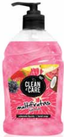
Multifrutas Multifruit Multifruitiers Multifrutas

Doseador, 500 ml Un. p/Cx: 1x6 Cód.: 5600441652001