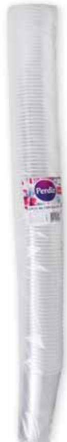
Copos de Cerveja Beer Glasses Verres de Bière Vasos de Cerveza

200 ml, 100 un Un. p/Cx: 1x1 Cód.: 5600441619257