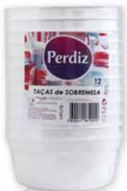
Taças de Sobremesa Dessert Bowls Bols à Dessert Postre Copas

250 ml, 100 un Un. p/Cx: 1x1 Cód.: 5600441619264