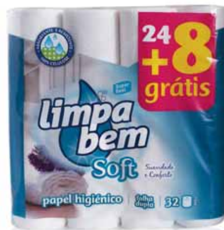
Soft (Folha Dupla) Soft (Double Sheet) Soft (Feuille Double) Soft (Doble Hoja)

12 rolos Un. p/Cx: 1x15 Cód.: 5600441628334