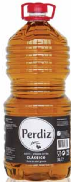
Clássico Virgem Extra Classic Extra Virgin Extra Vierge Classique Virgen Extra Clásico

0,75 Lt Un. p/Cx: 1x12 Cód.: 5600441614160