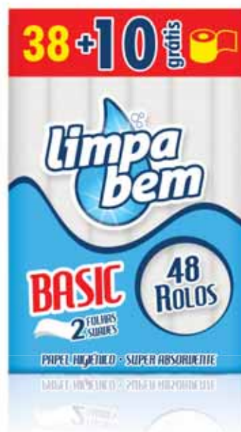
Basic (Folha Dupla) Basic (Double Sheet) Basic (Feuille Double) Basic (Doble Hoja)

12 rolos Un. p/Cx: 1x15 Cód.: 5600441628365