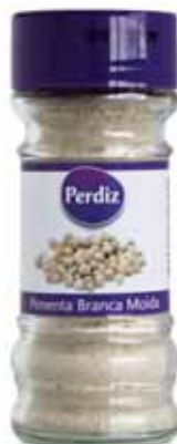
Pimenta Branca Moída Milled White Pepper Poivre Blanc Moulu Pimienta Blanca Molida