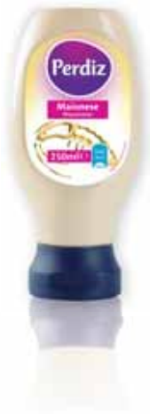
Maionese Top Down Mayonnaise Top Down Mayonnaise Top Down Mayonesa Top Down

450 ml Un. p/Cx: 1x12 Cód.: 5600441612630