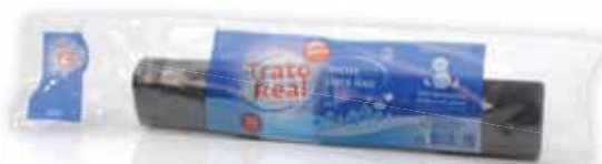
Sacos Lixo Garbage Bags Sacs à Ordures Bolsa Basura

55x55, 30 Lt, 15 un Un. p/Cx: 5x10 Cód.: 5600441669207