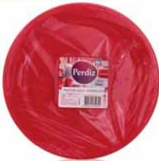
Pratos Refeição Descartáveis Vermelhos Red Disposable Plates Meal Rouge Jetables Assiettes Repas Platos Comida Desechables Rojos

22 cm, 25 un Un. p/Cx: 1x1 Cód.: 5600441619721