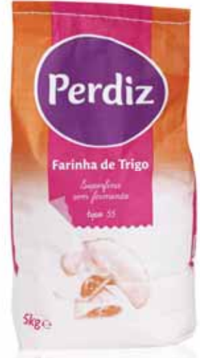
Trigo Tipo 55 Type 55 Wheat Tapez 55 Blé Trigo Tipo 55

s/Fermento, 5 kg Un. p/Cx: 1x1 Cód.: 5600441618059