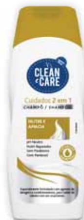
Cuidados 2 em 1 Care 2 in 1 Soins 2 le 1 Cuidado 2 en 1

250 ml Un. p/Cx: 1x12 Cód.: 5600441654050