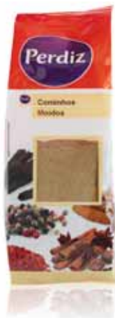
Cominhos Moidos Milled Cumins Sachet Cominos Molidos