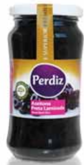
Preta Oxidada Laminada Rusty Black Laminated Rusty Noire Feuilleté Negra Oxidada Laminada

210 gr Un. p/Cx: 1x12 Cód.: 5600441613101