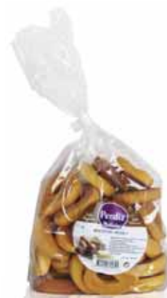
Biscoitos Argolas Cookies Rings Cookie Anneaux Bizcochos Argollas

400 gr Un. p/Cx: 1x10 Cód.: 5600441615556