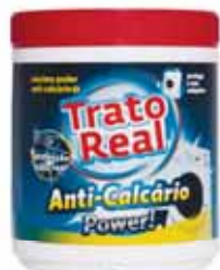
Power Anti-Calcário Power Anti Calcareous Power Anticalcaire Power Anti-Cal