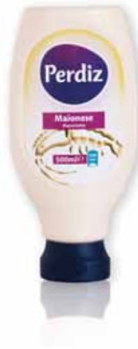
Maionese Top Down Mayonnaise Top Down Mayonnaise Top Down Mayonesa Top Down

250 gr Un. p/Cx: 1x6 Cód.: 5601517161410