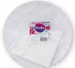
Pratos Cartão c/ Naperon Dishes Card with Naperon Carte avec des Plats Naperon Platos Cartón c/Napperon

Nº 5 - 1 un Un. p/Cx: 10x10 Cód.: 5600441619561