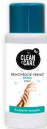
Menta Mint Menthe Menta

250 ml Un. p/Cx: 1x12 Cód.: 5600441650212