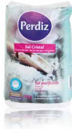
Sal Cristal Square Crystal Cristal de Sel Sal Cristal

Almofada, kg Un. p/Cx: 1x20 Cód.: 5601118000378