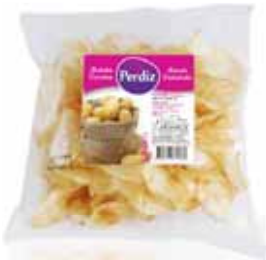
Frita Ondulada Wavy Chips Frites Ondullées Fritas Onduladas

100 gr Un. p/Cx: 1x30 Cód.: 5600441614580