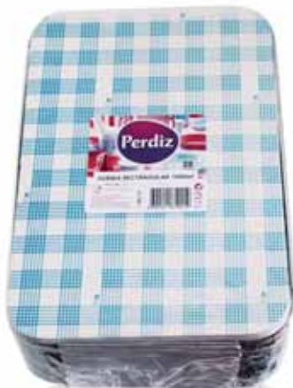
Forma Rectângular Rectangular Form Forme de Rectangulaire Forma Rectangular

450 ml - 25 un Un. p/Cx: 1x25 Cód.: 5600441619301