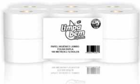
Papel Higiênico Jumbo Green, Folha Dupla Toilet Paper Jumbo Green, Double Sheets Papier de Toilette Vert, Deux Feuille Papel Higiênico Jumbo, Reciclabel, Hoja Doble

1x12, 120 Mt Un. p/Cx: 1x12 Cód.: 5600441628600