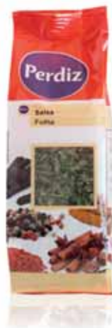
Salsa Folha Parsley Leaf Feuille de Persil Perejil Hoja