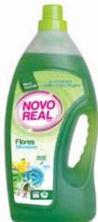
Flores Silvestres Wild Flowers Fleurs Sauvages Flores Silvestres

3 Lt, 40 doses Un. p/Cx: 1x5 Cód.: 5600441630016