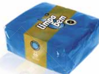
Folha Dupla Azul Blue Double Sheet Double Feuille Bleu Doble Hoja Azul

40x40 cm, 40 un Un. p/Cx: 1x24 Cód.: 5600441628440