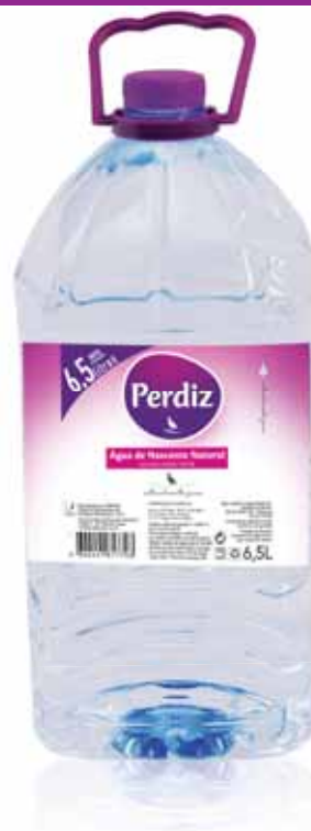
Água de Nascente Spring Water L'eau de Source Agua de Manantial

5 Lt, PACK 3 Un. p/Cx: 1x3 Cód.: 5600441617024