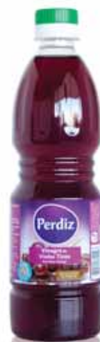
Vinho Tinto Red Wine Vinaigre de Vin Vino Tinto

500 ml Un. p/Cx: 1x20 Cód.: 5600441611107