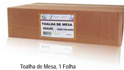
Toalha de Mesa, 1 Folha Paper Tablecloths, 1 Sheet Serviettes en Papier pour Table, 1 Feuille Mante, 1 Hoja

30x45 cm, 1000 un Un. p/Cx: 1x1 Cód.: 5600441628174