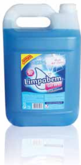
Gel Casa de Banho WC Bathroom Gel WC Gel Salle de Bain WC Gel Baño WC

GAMA INDUSTRIAL | INDUSTRIAL RANGE | GAMME INDUSTRIELLE | GAMA INDUSTRIAL