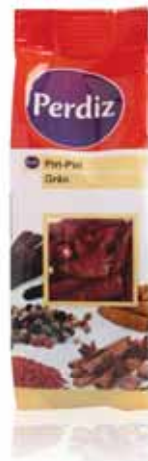
Piri-Piri Grão Piri-Piri grain Piri Piri Piri-Piri Grano