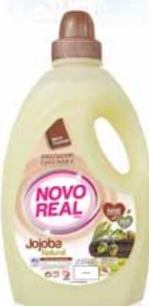
Jojoba Natural Natural Jojoba Jojoba Naturel Jójoba Naturales