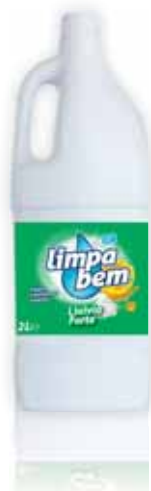
Forte Strong Fort Fuerte