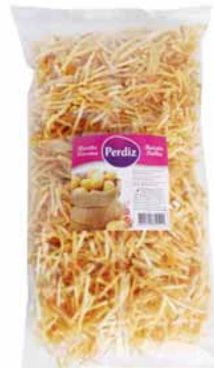
Frita Palha Thatched Chips Frites Paille Patata paja

500 gr Un. p/Cx: 1x15 Cód.: 5600441614511