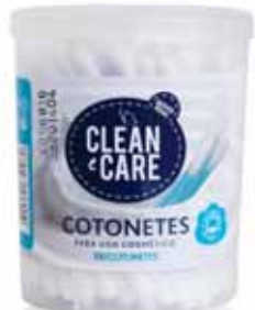
Cotonetes Swabs Écouvillons Bastoncillos

50 un Un. p/Cx: 12x12 Cód.: 5600441651073