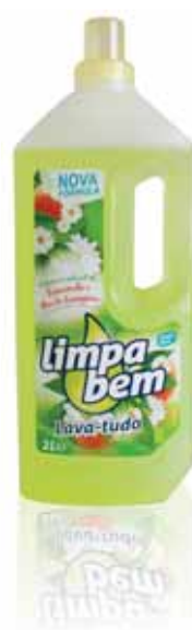
Camomila e Flor de Laranjeira Chamomile and orange Blossom Camomille et Fleur d'Oranger Mazanilla y Flor de Naranja