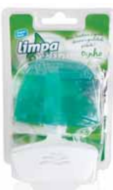
Bloco Sanitário Pinho Sanitary Block Pine Bloc Sanitaire Pine Colgador WC Pino

Líquido Un. p/Cx: 1x12 Cód.: 5600441626088