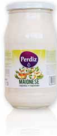
Maionese Mayonnaise Mayonnaise Mayonesa

225 ml Un. p/Cx: 1x6 Cód.: 5600441612647