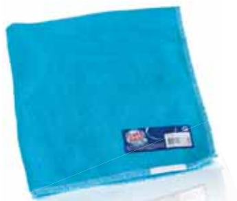
Pano de Felpo Terry Cloth Tissu Éponge Paño de Felpa

42+42 Un. p/Cx: 12x12 Cód.: 5600441668330