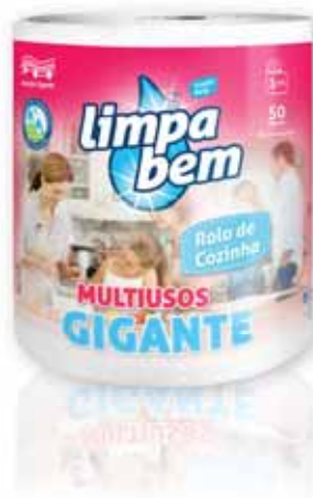
Multiusos Gigante Multipurpose Giant Polyvalent Géant Multiusos Gigante

1 = 15 Un. p/Cx: 1x6 Cód.: 5600441628327