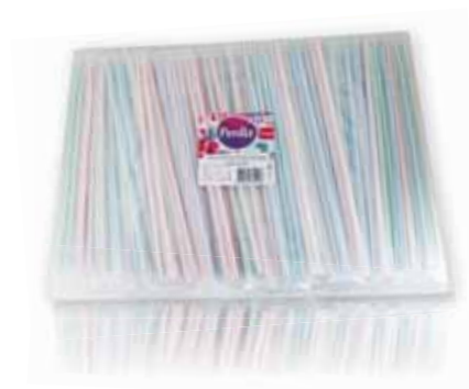
Palhinhas Indiv. Listadas Individual Listed Straws Pailles Colorées Individuel Pajitas Individuales Rayas

50 un Un. p/Cx: 10x20 Cód.: 5600441619042