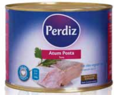
Atum Posta em Óleo Tuna Fish Chop in oil Boîte de Thon Vente à L'Huile Atún Posta en Aceite

385 gr Un. p/Cx: 1x24 Cód.: 5600441610445