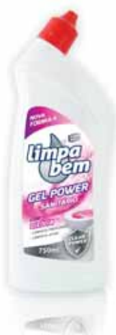
Gel Sanitário com Lixívia Sanitary Leaches Gel Gel Sanitaire avec Lessive Gel Sanitário de Baño Lejía

1,5 Lt Un. p/Cx: 1x12 Cód.: 5600441623117