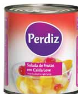
Salada de Frutas Lata Fruit Salada Fruits au Sirop Macedonia de Frutas Lata