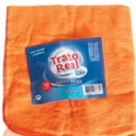
Pano Pó Cloth Powder Chiffon à Poussière Paño Polvo

40x60, 80% Algodão Un. p/Cx: 1x12 Cód.: 5600441668392