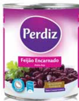
Encarnado Red Rouges Encarnado

Lata 420 gr Un. p/Cx: 1x12 Cód.: 5601474387045