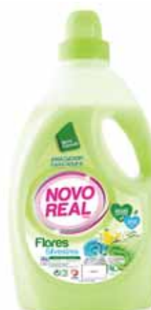
Flores Silvestres Wild Flowers Fleurs Sauvages Flores Silvestres