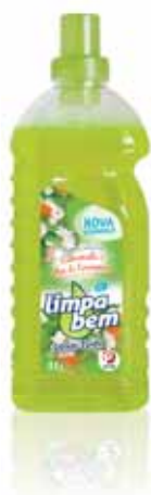
Camomila e Flor de Laranjeira Chamomile and Orange Blossom Camomille et Fleur d'Oranger Mazanilla y Flor de Naranja