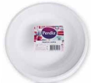
Pratos Sopa Soup Plates Assiette à Soup Plato p/Sopa