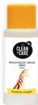
Limão Lemon Citron Limón

250 ml Un. p/Cx: 1x12 Cód.: 5600441650236