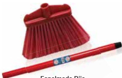
Espalmada Rija Tough Flattened Difficile Aplatie Cepillo Rijida

Cabo Metálico Un. p/Cx: 1x6 Cód.: 5600441668071