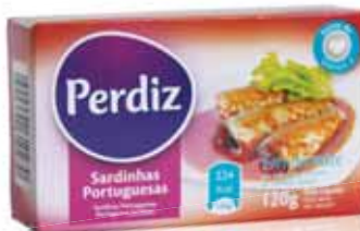
Sardinhas em Tomate Sardines in Tomato Sardines à La Tomate Sardinas en Tomate

120 gr Un. p/Cx: 1x10 Cód.: 5600441610223