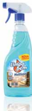
Limpa Multiusos Multipurpose Cleaner Polyvalent Détergent Limpador Multiusos

750 ml Un. p/Cx: 2x9 Cód.: 5600441624015