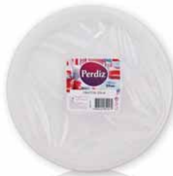
Pratos Refeição 22 cm Meal Dishes 22 cm Plats du Repas 22 cm Platos Comida 22 cm

22 cm, 100 un Un. p/Cx: 1x8 Cód.: 5600441619486