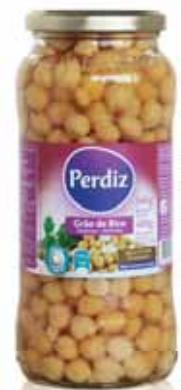
Grão de Bico Frasco Chickpeas Vial Pois Chique Bouteille Garbanzo Frasco

540 gr Un. p/Cx: 1x12 Cód.: 5600441610094