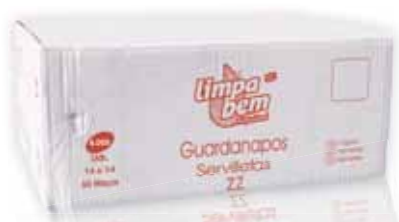
Guardanapos Zig Zag Napkins Zig Zag Serviettes Zig Zag Servilletas Zig Zag

6 Rolos, 100 mt Un. p/Cx: 1x6 Cód.: 5600441628525