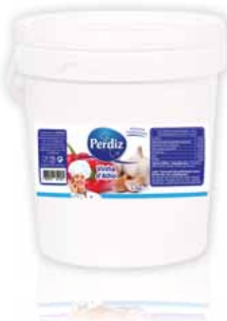
Vinha d'Alho Vineyard Pepper d'Ail Vigne Vinha de Ajo

5,7 kg Un. p/Cx: 1x1 Cód.: 5600441612180