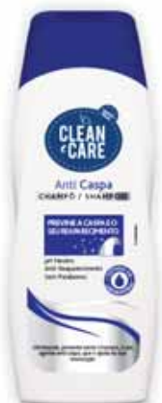
Anti Caspa Dandruff Pellicules Anticaspa

250 ml Un. p/Cx: 1x12 Cód.: 5600441654067