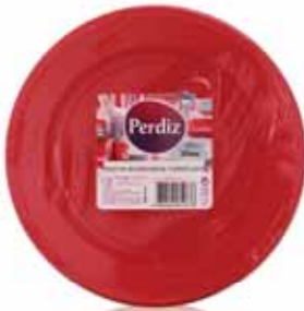
Pratos Sobremesa Descartáveis Vermelhos Red Disposable Dessert Plates Dessert Jetables Plaques Rouge Platos Postre Desechables Rojos