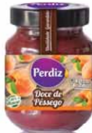
Pêssego Peach Pêche Melocotón

340 gr. Un. p/Cx: 1x6 Cód.: 5600441615822