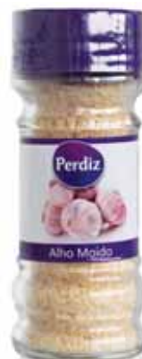
Alho Moído Milled Garlic Épices Ail Écrasé Ajo Molido