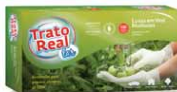
Vinil Multiusos Vinyl Multipurpose Vinyle Multi-Usages Vinilo Multiusos

100 un, Tam L Un. p/Cx: 1x10 Cód.: 5600441665063