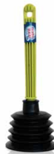
Desentupidor de Fole c/Cabo Plunger of Bellows with Cable Tuyaux de Plomb avec Soufflet Câble Desatascador de Muelle c/Mango