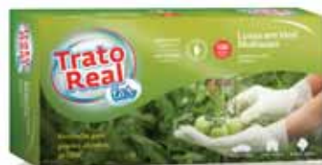
Vinil Multiusos Vinyl Multipurpose Vinyle Multi-Usages Vinilo Multiusos

100 un, Tam S Un. p/Cx: 1x10 Cód.: 5600441665018