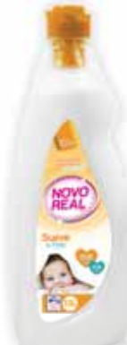
Suave e Fofo Soft and Fluffy Doux et Pelucheux Suave y Delicado

1,5 Lt Un. p/Cx: 1x9 Cód.: 5600441632140