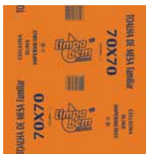
Toalha de Mesa, 1 Folha Paper Tablecloths, 1 Sheet Serviettes en Papier pour Table, 1 Feuille Toalha de Mesa, 1 Folha

65x65 cm, 220 un Un. p/Cx: 1x1 Cód.: 5600441628532