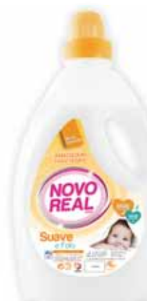
Suave e Fofo Soft and Fluffy Doux et Pelucheux Suave y Delicado