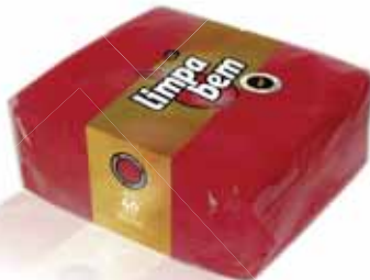
Folha Dupla Bordeaux Bordeaux Double Sheet Double Feuille Rouge Doble Hoja Burdeos

40x40 cm, 40 un Un. p/Cx: 1x24 Cód.: 5600441628433