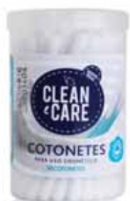
Cotonetes Swabs Écouvillons Bastoncillos

50 un Un. p/Cx: 12x12 Cód.: 5600441651073