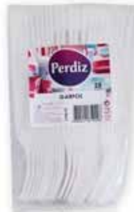
Garfos Brancos White Forks Fourches Blancs Tenedores Blancos

25 un Un. p/Cx: 10x10 Cód.: 5600441619233