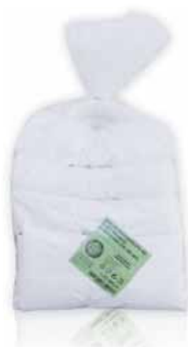
Branco White Blanc Blanco

900x1300, 10 kg Un. p/Cx: 1x10 Cód.: 5600441668279