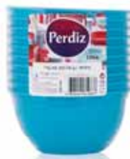
Taças p/Sopa Descartáveis Azuis Blue Bowl of Soup Bols pour soupe Bleu Tarro p/Sopa Azul