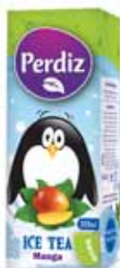
Manga Mango Mangue Manga

200 ml Un. p/Cx: 3x8 Cód.: 5600441617499