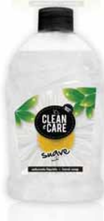
Suave Smooth Suave Suave

Doseador, 500 ml Un. p/Cx: 1x6 Cód.: 5600441652117