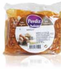
Nougat Nougat Nougat Turrón

250 gr Un. p/Cx: 1x24 Cód.: 5600441615389