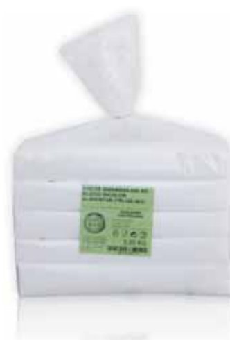
Saco Bloco Block Bag Pack Sac Bolsa Bloco

45x55, Milheiro Un. p/Cx: 1x10 Cód.: 5600441669092