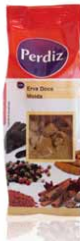
Erva Doce Moída Milled Fennel Fenouil Moulu Hierba Dulce Molida