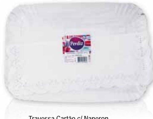
Travessa Cartão c/ Naperon Card Platter with Naperon Carte Plateau avec Naperon Bandeja Cartón c/Napperon

Nº 7 E - 1 un Un. p/Cx: 10x10 Cód.: 5600441619639