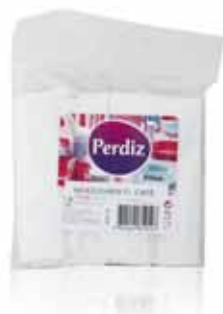
Palhetas Indiv. para Café Individual Vanes for Coffee Rouseaux por le Café Paletas Indiv. para Café

100 un Un. p/Cx: 10x10 Cód.: 5600441619134