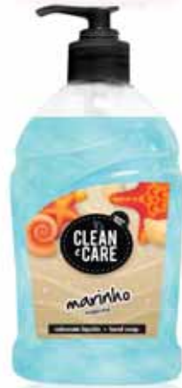
Marinho Marine Marin Marino

Doseador, 500 ml Un. p/Cx: 1x6 Cód.: 5600441652032