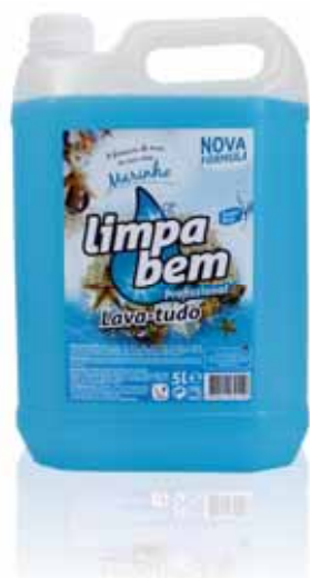
Lava-tudo Marinho Purpose Cleaners Marine Nettoyants Tout Marin Limpiador Marino

GAMA INDUSTRIAL | INDUSTRIAL RANGE | GAMME INDUSTRIELLE | GAMA INDUSTRIAL