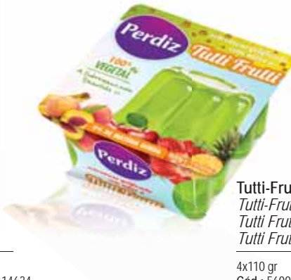
Tutti-Frutti Tutti-Frutti Tutti Frutti Tutti Frutti