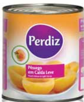
Pêssego Lata Peach Can Pêches en Conserve Melocotón