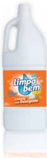
Com Detergente With Detergent Avec Détergent Con Detergente