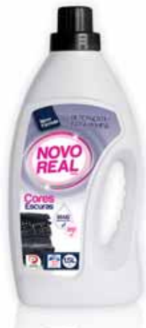
Roupa Escura Dark Clothing Vêtements Sombres Ropa Oscura

3 Lt, 40 doses Un. p/Cx: 1x5 Cód.: 5600441630030