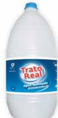
Água Destilada Distilled Water L'eau Distillée Agua Destilada

2,5 Lt Un. p/Cx: 1x6 Cód.: 5600441663014