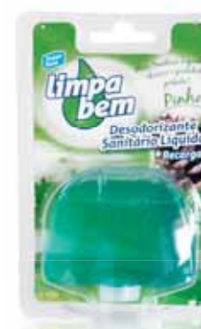
Bloco Sanitário Pinho Sanitary Block Pine Bloc Sanitaire Pine Colgador WC Pino

Recarga, Líquido Un. p/Cx: 1x12 Cód.: 5600441626101