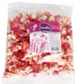
Pipocas com Sabor a Morango Popcorn with Strawberry Flavor Pop-corn Aromatisé aux Fraises Palomitas con Sabor a Fresa

70 gr Un. p/Cx: 1x16 Cód.: 5600441614542