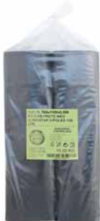
Saco Lixo Baixa Densidade Low Density Garbage Bag Sac à Ordures en Faible Densité Bolsa Basura Baja Densidad

200x300, 500 un Un. p/Cx: 1x10 Cód.: 5600441669009