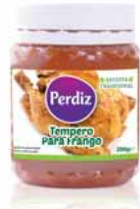
Tempero de Frango Seasoning Garlic with Chicken Assaisonnement pour Poulet Condimento de Pollo

200 gr Un. p/Cx: 1x12 Cód.: 5600441612074