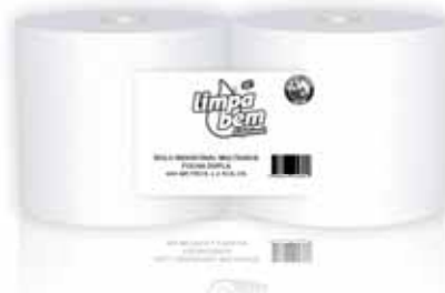
Celulose Industrial Multisusos Green, Folha Dupla Cellulose Industrial Multipurpose Green, Double Sheets Cellulosa Industrial Polyvalent Vert, Deux Feuille Celulosa Industrial Multiusos Reciclabel Hoja Doble

1x6, 100 Mt Un. p/Cx: 1x6 Cód.: 5600441628624