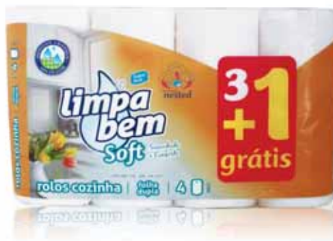
Rolo de Cozinha Kitchen Rolls Rouleaux de Cuisine Rollos de Cocina

2 rolos Un. p/Cx: 1x24 Cód.: 5600441628310