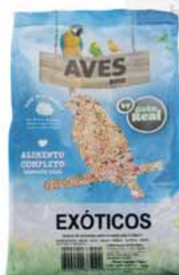
Exóticos Exotics Exotiques Exóticos