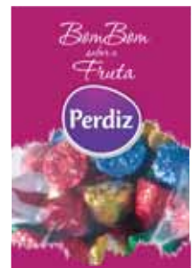
Sabor a Fruta Fruity Fruité Sabor a Fruta

Saco kg Un. p/Cx: 1x10 Cód.: 5600441615068