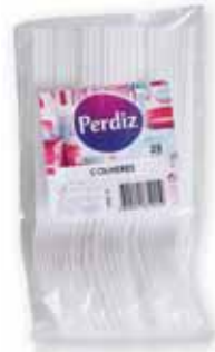
Colheres Brancas White Spoons Cuillères Blancs Cucharas Blancas

25 un Un. p/Cx: 10x10 Cód.: 5600441619226