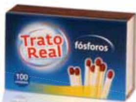
Fósforos Matches Phosphre Cerillas

PRODUTOS DO LAR | HOME PRODUCTS | PRODUITS POUR LA MAISON | PRODUCTOS PARA EL HOGAR