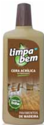
Madeira Wood Bois Madera

500 ml Un. p/Cx: 1x12 Cód.: 5600441624114