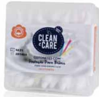
Cotonetes c/Proteção para Bebés Swabs with Protection for Babies Écouvillons avec Protection pour les Bébés Bastoncillos c/Protección para Bebés

200 un Un. p/Cx: 4x12 Cód.: 5600441651097