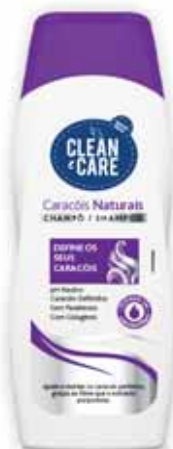
Caracóis Naturais Natural Snails Escargots Naturelles Rizados Naturales

250 ml Un. p/Cx: 1x12 Cód.: 5600441654005