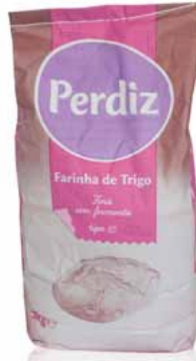
Trigo Tipo 65 Type 65 Wheat Tapez 65 Blé Trigo Tipo 65

s/Fermento, kg Un. p/Cx: 1x10 Cód.: 5600441618038