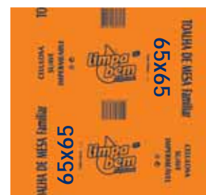
Toalha de Mesa, 1 Folha Paper Tablecloths, 1 Sheet Serviettes en Papier pour Table, 1 Feuille Toalha de Mesa, 1 Hoja

60x60 cm, 220 un Un. p/Cx: 1x1 Cód.: 5600441628181