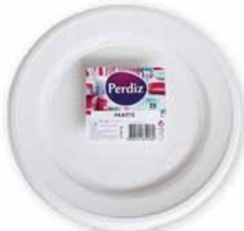
Pratos Segundo Seconds Dishes Assiette Segundos Platos