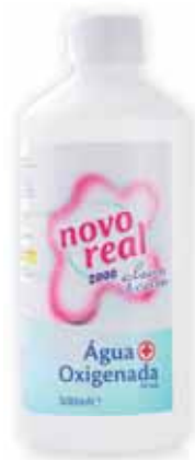
Água Oxigenada Oxygenated Water Le Peroxyde d'Hydrogène Agua Oxigenada

250 ml Un. p/Cx: 1x12 Cód.: 5600441650021