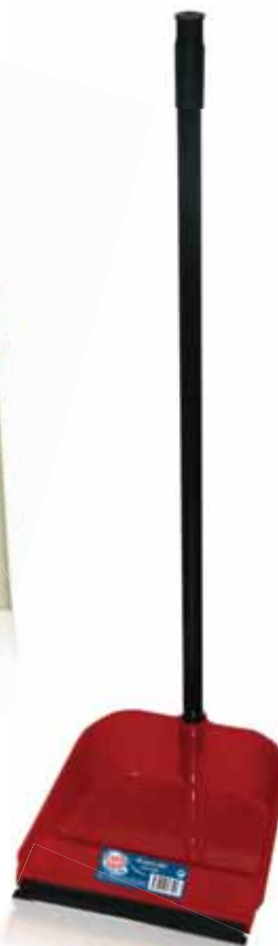
Pá Lixo Garbage Shovel Pelle à Poussière Trash Pala

c/ Cabo e Borracha Un. p/Cx: 1x6 Cód.: 5600441668118