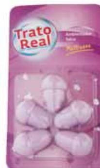
Ambientador Talco Talc Freshener Assainisseur Talc Ambientador Talco

32 un Un. p/Cx: 2x14 Cód.: 5600441667036