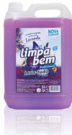
Lava-tudo Lavanda Purpose Cleaners Lavender Nettoyants Tout Lavande Limpiador Lavanda