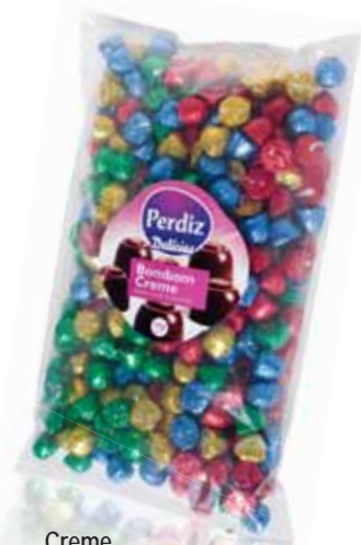
Creme Cream Crème Crema

Balde kg Un. p/Cx: 1x6 Cód.: 5600441615709