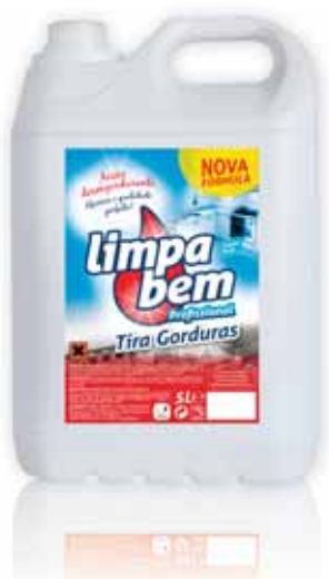
Tira Gorduras Degreaser Dégraissant Quitá Grasas