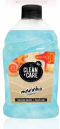
Marinho Marine Marin Marino

Doseador, 500 ml Un. p/Cx: 1x6 Cód.: 5600441652094