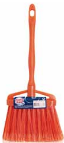
Vassourinha p/ Pá Lixo Shovel Waste Broom Balai Pelle Escoba p/Recogedor Basura