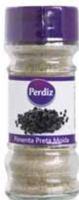
Pimenta Preta Moída Milled Black Pepper Poivre Noir Moulu Pimienta Negra Molida