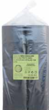
Saco Lixo Baixa Densidade Low Density Garbage Bag Sac à Ordures en Faible Densité Bolsa Basura Baja Densidad

800x1110, 10 kg Un. p/Cx: 1x10 Cód.: 5600441668255