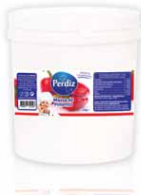
Massa de Pimentão Pepper Mass Poivre Masse Masa de Pimentón

1,2 kg Un. p/Cx: 1x6 Cód.: 5600441612142