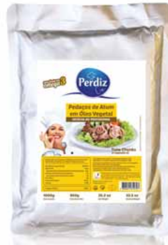
Atum em Óleo Vegetal Tuna in Vegetable Oil Thon à L'huile Végétale Atún en Aceite Vegetal

1730 gr Un. p/Cx: 1x6 Cód.: 5600441610788