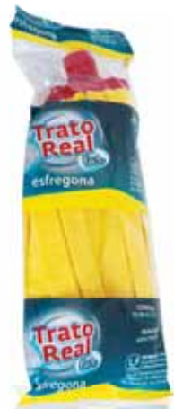
Recarga (Tiras Amarelas) Refill (Yellow Strips) Recharge (Bandes Jaunes) Recarga (Tiras Amarillas)

ARTIGOS LIMPEZA | CLEANING ARTICLES | ARTICLES DE NETTOYAGE | ARTÍCULOS DE LIMPIEZA