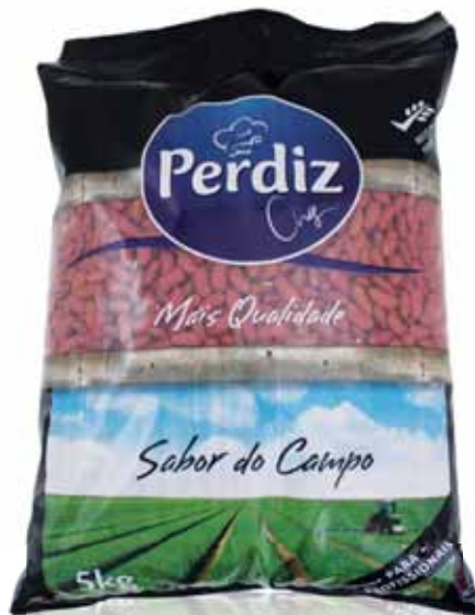
Encarnado Red Rouges Encarnado

Seco 5 kg Un. p/Cx: 1x1 Cód.: 5600441610629