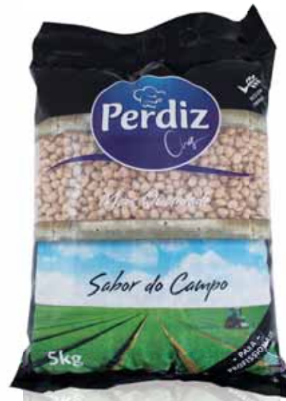
Grão de Bico Chickpeas Pois Chique Garbanzo

Seco 5 kg Un. p/Cx: 1x1 Cód.: 5600441610711