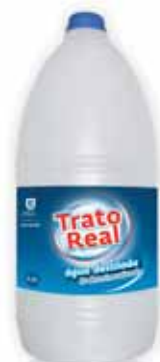
Água Destilada Distilled Water L'eau Distillée Agua Destilada

2,5 Lt Un. p/Cx: 1x6 Cód.: 5600441663014