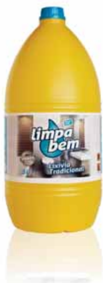
Tradicional Traditional Traditionnel Tradicional