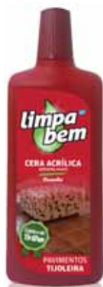
Tijoleira Brick Flooring Revêtement Brique Pavimentos Porosos

500 ml Un. p/Cx: 1x12 Cód.: 5600441624114