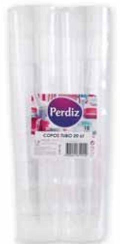
Copos Tubo Tube Glasses Verres Tube Vasos de Tubo

20 cl, 10 un Un. p/Cx: 1x50 Cód.: 5600441619431