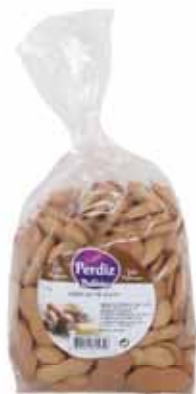
Linguas de Gato Linguas de Gato Linguas de Gato Lenguas de Gato

150 gr Un. p/Cx: 1x10 Cód.: 5600441615549