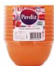
Taças p/Sopa Descartáveis Laranjas Orange Bowl of Soup Bols pour soupe Orange Tarro p/Sopa Naranja