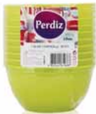
Taças p/Sopa Descartáveis Verdes Green Bowl of Soup Bols pour Soupe Verte Tarro p/Sopa Verde

25 un Un. p/Cx: 1x20 Cód.: 5600441619202