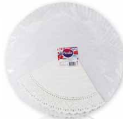
Pratos Cartão c/ Naperon Dishes Card with Naperon Carte avec des Plats Naperon Platos Cartón c/Napperon

Nº 9 - 1 un Un. p/Cx: 10x10 Cód.: 5600441619592