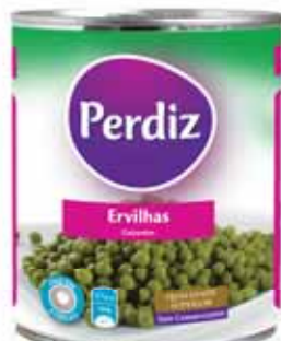
Ervilhas Peas Pois Guisantes

420 gr Un. p/Cx: 1x12 Cód.: 5601474387052