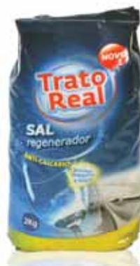
Sal Regenerador Máquina Loiça Regenerating Salt Machine Sel Régénérant Lave-Vaisselle Sal Regenerador Máquina Loza