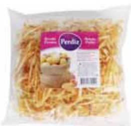
Frita Palha Thatched Chips Frites Paille Patata paja

180 gr Un. p/Cx: 1x20 Cód.: 5600441614535