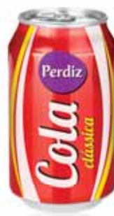
Cola Coke Colle Cola

1,5 Lt Un. p/Cx: 1x6 Cód.: 5600441617680