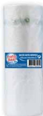
Saco em Rolo Bag on Roll Sac sur Rouleau Bolsa en Rollo

300x400, 500 un Un. p/Cx: 1x10 Cód.: 5600441669023