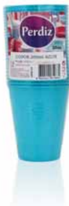
Copos Descartáveis Azuis 200 ml Blue Disposable Cups 200 ml Tasses Bleues Jetables 200 ml Vasos Desechables Azules

12 un Un. p/Cx: 1x50 Cód.: 5600441619448