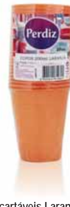
Copos Descartáveis Laranjas 200 ml Orange Disposable Cups 200 ml Tasses Orange Jetables 200 ml Vasos Desechables Naranjas