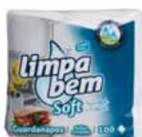
Soft Folha Simples Soft Simple Sheet Soft Feuille Simple Soft Hoja Simple

33x33 cm, 80 un Un. p/Cx: 1x30 Cód.: 5600441628044