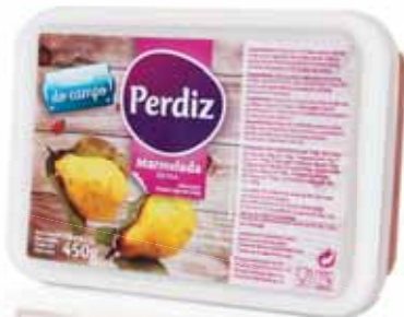
Marmelada Fruit Jelly Marmelade Mermelada

450 gr Un. p/Cx: 1x12 Cód.: 5600441615037