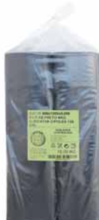
Saco Lixo Baixa Densidade Low Density Garbage Bag Sac à Ordures en Faible Densité Bolsa Basura Baja Densidad

800x1200, 10 kg Un. p/Cx: 1x10 Cód.: 5600441668262