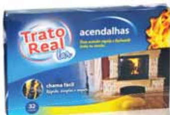
Acendalha Sólida Solid Firelighters Solide Allumette Pastillas de Encendido

100 un Un. p/Cx: 24x20 Cód.: 5600441667029