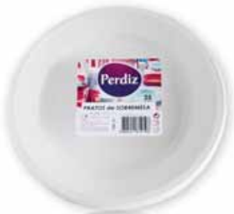
Pratos Sobremesa Dessert Plates Assiettes à Dessert Platos Postre

22 cm, 25 un Un. p/Cx: 6x4 Cód.: 56004416194796