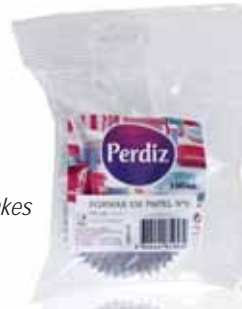
Formas de Papel p/ Queques Forms of Paper for Cupcakes Les Formes de Papier pour Cupcakes Formas de Papel p/Queques

Nº 5 - 100 un Un. p/Cx: 10x10 Cód.: 5600441619523