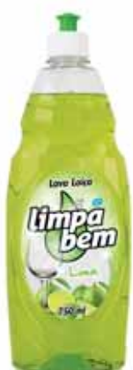
Lima Lime Lime Lima

750 ml Un. p/Cx: 1x10 Cód.: 5600441622080