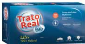
Látex Multiusos Multipurpose Latex Latex à Usages Multiples Látex Multiusos

1 Par Tam. S Un. p/Cx: 1x12 Cód.: 5600441665070 (Amarela) Cód.: 5600441665117 (Rosa)