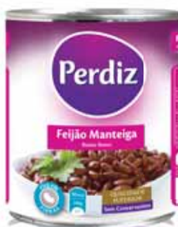
Manteiga Butter Beurre Manteca

Lata 820 gr Un. p/Cx: 1x12 Cód.: 5601474386024