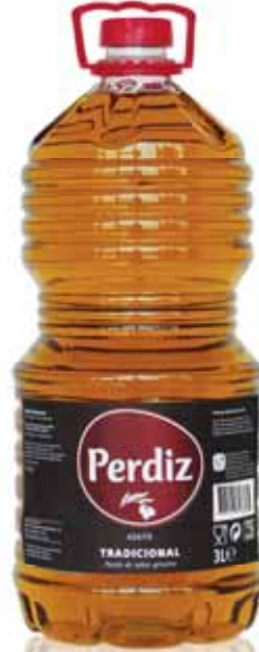
Tradicional Traditional Tradicionnelle Tradicional