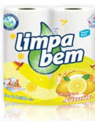
Rolo de Cozinha Limão Lemon Kitchen Rolls Rouleaux de Cuisine Citron Rollo de Cocina Limón

1 un (30 mt.) Un. p/Cx: 1x12 Cód.: 5600441628389