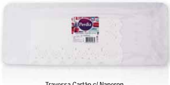
Travessa Cartão c/ Naperon Card Platter with Naperon Carte Plateau avec Naperon Bandeja Cartón c/Napperon

Nº 6 - 1 un Un. p/Cx: 10x10 Cód.: 5600441619622