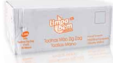
Toalhas Mão Zig Zag Paper Hand Towels Zig Zag Serviettes en Papier pour le Main Zig Zag Toallas de Mano Zig Zag

23x21 cm, 20 maços (3000 un) Un. p/Cx: 20x130 Cód.: 5600441628150