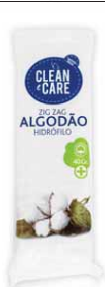
Algodão Zig Zag Zig Zag Cotton Zig Zag Coton Algodón Zig Zag

40 gr Un. p/Cx: 18x10 Cód.: 5600441651141