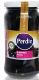
Preta Oxidada 261/290 Rusty Black 261/290 Rusty Noire 261/290 Negra Oxidada 261/290

200 gr Un. p/Cx: 1x12 Cód.: 5600441613156