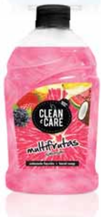
Multifrutas Multifruit Multifruitiers Multifrutas

Doseador, 500 ml Un. p/Cx: 1x6 Cód.: 5600441652025