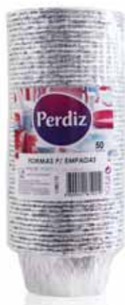
Forma p/ Empadas Form for Patty Forme de Empade Forma p/Empadas

2400 ml - 25 un Un. p/Cx: 1x12 Cód.: 5600441619363