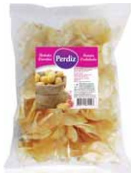
Frita Ondulada Wavy Chips Frites Ondullées Fritas Onduladas

100 gr Un. p/Cx: 1x30 Cód.: 5600441614580