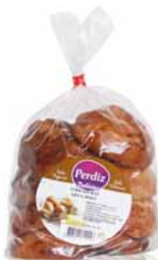
Ferraduras Erva Doce Ferraduras Fennel Ferraduras Fenouil Herraduras Hierva

250 gr Un. p/Cx: 1x12 Cód.: 5600441615358