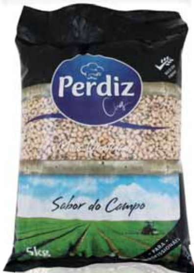
Frade Black - Eyed Niébé Pintas

Seco 5 kg Un. p/Cx: 1x1 Cód.: 5600441610599