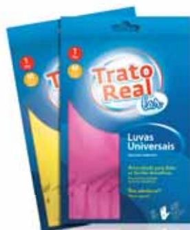
Universais Rosa e Amarelo Universal Pink and Yellow Universelles Rose et Jaune Universales Rosa y Amarillo

1 Par Tam. L Un. p/Cx: 1x12 Cód.: 5600441665094 (Amarela) Cód.: 5600441665131 (Rosa)