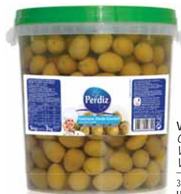
Verde Gordal 111/120 Green Gordal 111/120 Vert Gordal 111/120 Verde Gordal 111/120