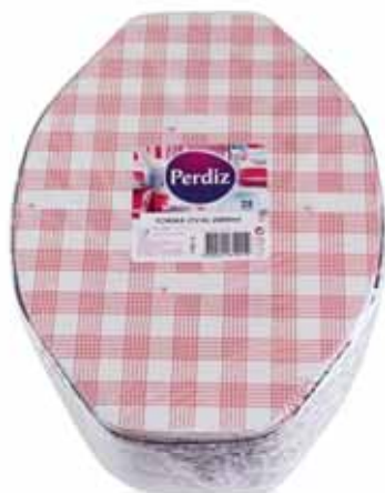
Forma Oval Oval Round Form Formes Oval Forma Oval

1450 ml - 25 un Un. p/Cx: 1x12 Cód.: 5600441619356