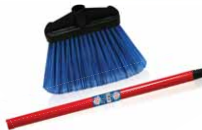
Espalmada Despontada Flattened Broom Balai Aplatie Cepillo Despuntado

Cabo de Madeira Un. p/Cx: 1x6 Cód.: 5600441668149