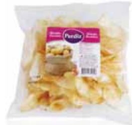
Frita Rodelas Roundels Chips Frites Tranchés Frita en Rodajas

180 gr Un. p/Cx: 1x20 Cód.: 5600441614597