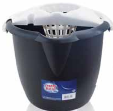
Balde + Esprededor Económico Bucket + Economic Wringer Seau + Presse Économique Cubo + Escurridor Económico