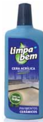
Cerâmicos Ceramic Céramique Ceramica

500 ml Un. p/Cx: 1x12 Cód.: 5600441624121