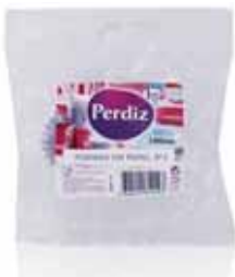
Formas de Papel p/ Queques Forms of Paper for Cupcakes Les Formes de Papier pour Cupcakes Formas de Papel p/Queques

3 Lt - 100 un Un. p/Cx: 1x10 Cód.: 5600441619554