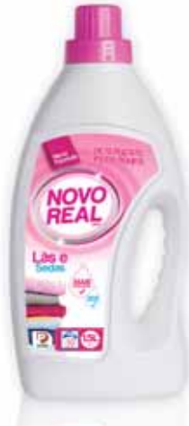
Lava Lãs e Sedas Wool and Silks Laine et Soie Lana y Seda

1,5 Lt, 30 doses Un. p/Cx: 1x10 Cód.: 5600441633024