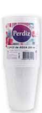
Copos de Água Water Glasses Verres d'Eau Vasos de Agua

200 ml, 25 un Un. p/Cx: 10x10 Cód.: 5600441619158