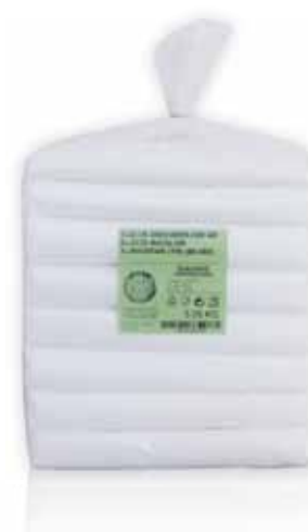
Saco Bloco Block Bag Pack Sac Bolsa Bloco

300x400, 5 kg Un. p/Cx: 1x5 Cód.: 5600441669115