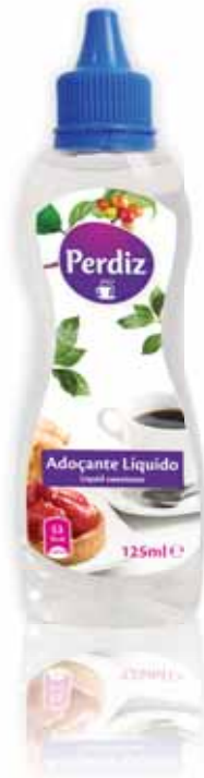
Adoçante Líquido Liquid Sweetener Édulcorant Liquide Sacarina Líquido

125 ml Un. p/Cx: 1x24 Cód.: 5600441615907