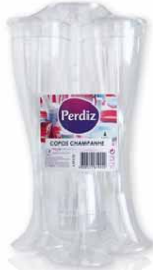
Copos de Champagne Champagne Drinkware Verres de Champagne Copas de Champán

80 ml, 25 un Un. p/Cx: 10x10 Cód.: 5600441619141