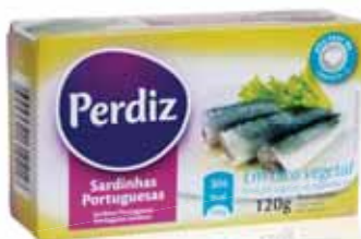
Sardinhas em Óleo Sardines in Oil Sardines à L'Huile Sardinas en Aceite

Pedaços Bolsa, 1 Kg Un. p/Cx: 1x16 Cód.: 5600441610797