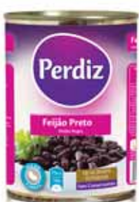
Preto Black Noir Negro

Lata 420 gr Un. p/Cx: 1x12 Cód.: 56014743387007