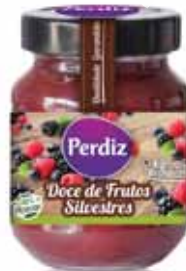
Frutos Silvestres Berries Baies Frutos del Bosque

340 gr. Un. p/Cx: 1x6 Cód.: 5600441615839