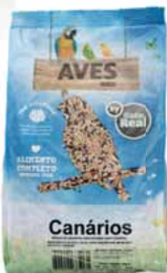
Canários Canaries Canaries Canários