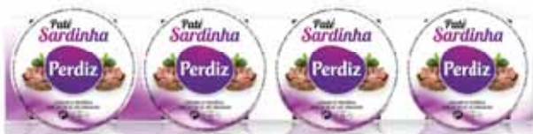
Sardinha Sardine Sardine Sardina

Pack 4 Un. p/Cx: 4x6 Cód.: 5600441610766