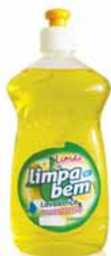
Ultra Concentrado Limão Ultra Concentrate Lemon Ultra Concentré Citron Ultra Concentrado Limón

500 ml Un. p/Cx: 1x12 Cód.: 5600441622042