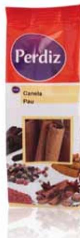
Canela Pau Cinnamon Stick Le Baton de Cannelle Canela Palo