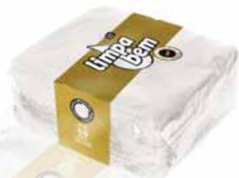
Folha Dupla Branco White Double Sheet Double Feuille Blanc Doble Hoja Blanco

33x33 cm, 70 un Un. p/Cx: 1x36 Cód.: 5600441628471