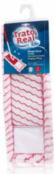
Mopa Seca Dry Mop Vandrouille Mopa Seca

45 cm Un. p/Cx: 1x12 Cód.: 5600441668187