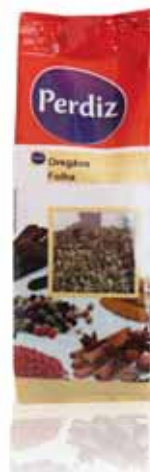
Oregãos Folha Origans Leaf Origan Orégano Hoja