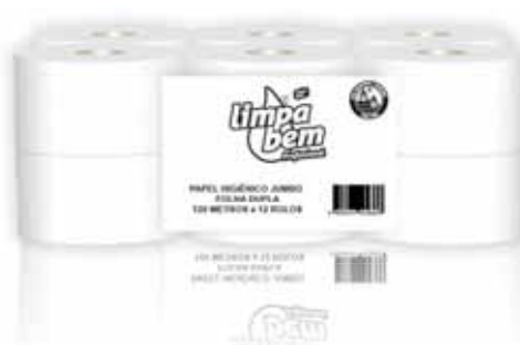
Papel Higiênico Jumbo Green, Folha Dupla Toilet Paper Jumbo Green, Double Sheets Papier de Toilette Vert, Deux Feuille Papel Higiênico Jumbo, Reciclabel, Hoja Doble

1x12, 90 Mt Un. p/Cx: 1x12 Cód.: 5600441628594