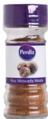
Noz Moscada Moída Milled Nutmeg Noix de Muscade Nuez Moscada Molida