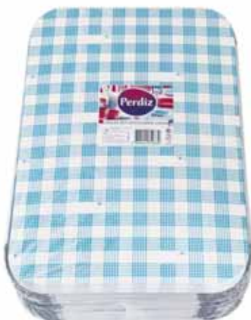
Forma Rectângular Rectangular Form Forme de Rectangulaire Forma Rectangular

950 ml - 25 un Un. p/Cx: 1x20 Cód.: 5600441619318