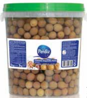
Maçanilha Mista 291/320 Mixed Maçanilha 291/320 Maçanilha Mista 291/320 Maçanilla Mixta 291/320

800 gr Un. p/Cx: 1x6 Cód.: 5600441613224