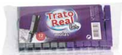
Molas Roupá Plástico Lilás e Prateada Spring Plastic Clothing Lilac and Silver Pincés à Linge Lilas et Argent Pinzas Ropa Plástico Lilas y Plateadas

12 un Un. p/Cx: 24x12 Cód.: 5600441668293