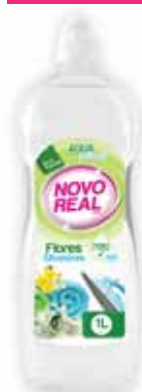
Flores Silvestres Wild Flowers Fleurs Sauvages Flores Silvestres

Água Perfumada, 1 Lt Un. p/Cx: 1x12 Cód.: 5600441634007