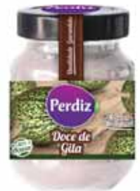
Gila Gila Gila Cabello de Angel

340 gr. Un. p/Cx: 1x6 Cód.: 5600441615853