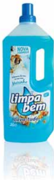
Marinho Marine Marin Marino