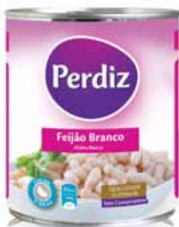
Branco White Blanc Blanco

Lata 820 gr Un. p/Cx: 1x12 Cód.: 5601474386031