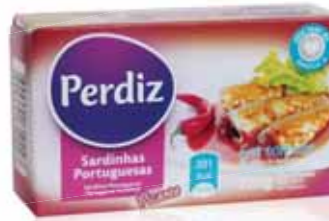
Sardinhas em Tomate Picante Sardines in Spicy Tomato Sardines à La Tomate Epicée Sardinas en Tomate Picante

120 gr Un. p/Cx: 1x10 Cód.: 5600441610230