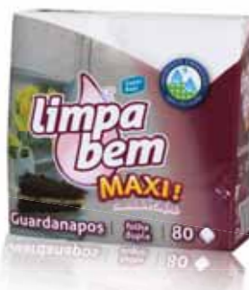
Maxi Folha Dupla Maxi Double Sheet Maxi Double Feuille Maxi Hoja Doble

22x22 cm, 100 un Un. p/Cx: 1x30 Cód.: 5600441628341