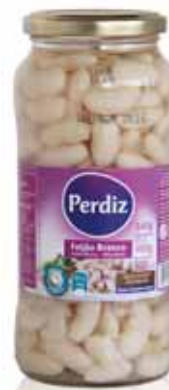
Branco Frasco White Vial Blanc Bouteille Blanco Frasco

540 gr Un. p/Cx: 1x12 Cód.: 5601474380633