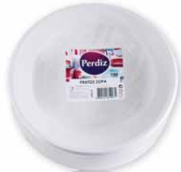
Pratos Sopa Soup Plates Assiette à Soup Plato p/Sopa

100 un Un. p/Cx: 1x1 Cód.: 5600441619288