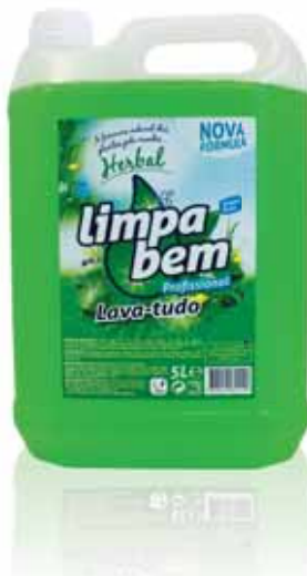
Lava-tudo Herbal Purpose Cleaners Herbal Nettoyants Tout Herbal Limpiador Herbal