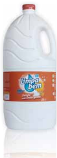
Com Detergente With Detergent Avec Détergent Con Detergente