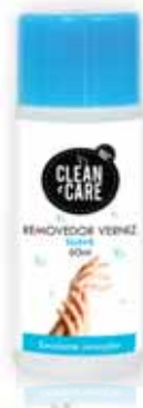
Suave Smooth Suave Suave

60 ml Un. p/Cx: 1x12 Cód.: 5600441650083