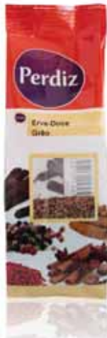
Erva-Doce Grain Fennel Fenouil Hierba-Dulce Grano