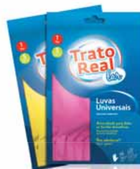
Universais Rosa e Amarelo Universal Pink and Yellow Universelles Rose et Jaune Universales Rosa y Amarillo

1 Par Tam. M Un. p/Cx: 1x12 Cód.: 5600441665087 (Amarela) Cód.: 5600441665124 (Rosa)