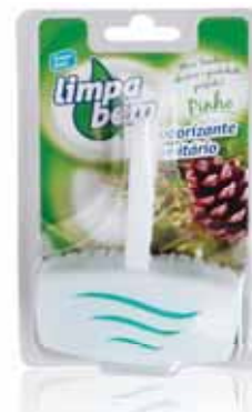
Bloco Sanitário Pinho Sanitary Block Pine Bloc Sanitaire Pine Colgador WC Pino

40 gr Un. p/Cx: 1x12 Cód.: 5600441626019