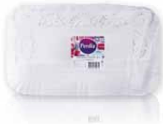
Travessa Cartão c/ Naperon Card Platter with Naperon Carte Plateau avec Naperon Bandeja Cartón c/Napperon

Nº 11 - 1 un Un. p/Cx: 10x10 Cód.: 5600441619608