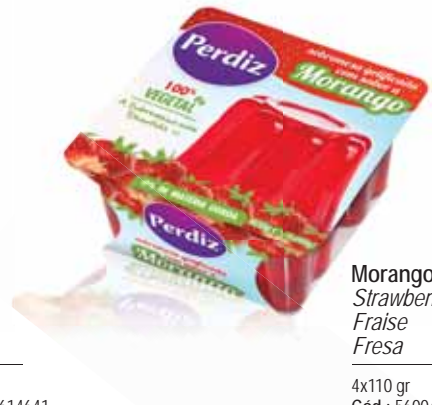
Morango Strawberry Fraise Fresa