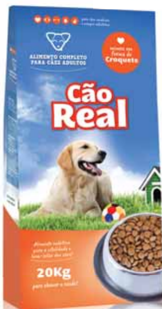
Cão Dog Chien Perro