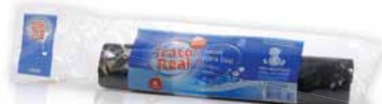
Sacos Lixo Garbage Bags Sacs à Ordures Bolsa Basura

55x55, 30 Lt, 15 un Un. p/Cx: 5x10 Cód.: 5600441669214