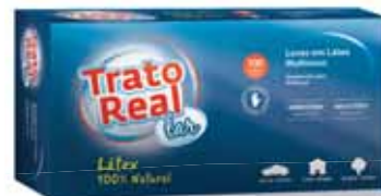
Látex Multiusos Multipurpose Latex Latex à Usages Multiples Látex Multiusos

100 un, Tam M Un. p/Cx: 1x10 Cód.: 5600441665025