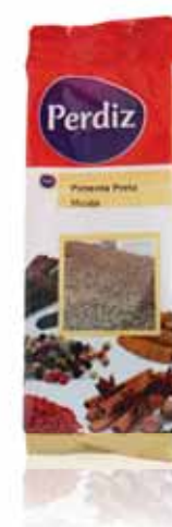
Pimenta Preta Moida Milled Black Pepper Poivre Noir Moulu Pimienta Negra Molida