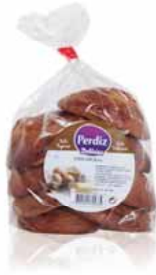
Ferraduras Ferraduras Ferraduras Ferraduras

250 gr Un. p/Cx: 1x14 Cód.: 5600441615402