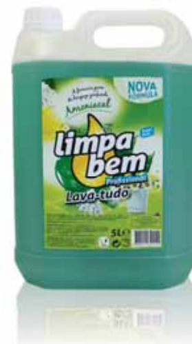
Lava-tudo Amoniacal Purpose Cleaners Ammoniacal Nettoyants Tout Ammoniaque Limpiador Amoniacal