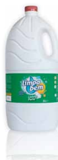
Forte Strong Fort Fuerte