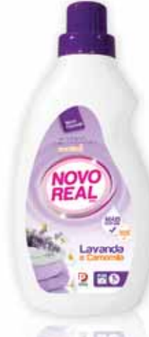
Concentrado Lavanda e Camomila Concentrated Lavender and Chamomile Concentré Lavande et Camomille Concentrada Lavanda y Mazanilla

1,5 Lt, 30 doses Un. p/Cx: 1x10 Cód.: 5600441633017