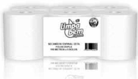
Seca Mãos Green, Folha Dupla Paper to Dry Hands Green, Double Sheets Papier Sèches Mains Vert, Deux Feuille Papel Seca Manos Reciclabel Hoja Doble

1x6, 100 Mt Un. p/Cx: 1x6 Cód.: 5600441628624