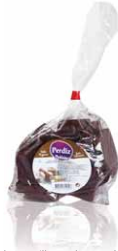
Delicias de Baunilhas cobertas c/Chocolate Vanilla Covered Chocolate Delights Plaisirs de Vanille Enrobées de Chocolat Delicias de Vainilla Cubiertas con Chocolate

400 gr Un. p/Cx: 1x10 Cód.: 5600441615334