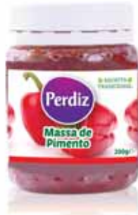
Massa de Pimentão Pepper Mass Poivre Masse Masa de Pimentón

200 gr Un. p/Cx: 1x12 Cód.: 5600441612135