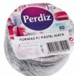
Forma p/ Pastel Nata Form for Pastel Cream Formes pour Pastel de Nata Forma p/Pastel Nata

50 un Un. p/Cx: 1x50 Cód.: 5600441619370