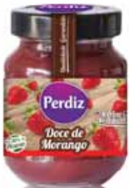
Morango Strawberry Fraise Fresa

340 gr. Un. p/Cx: 1x6 Cód.: 5600441615822