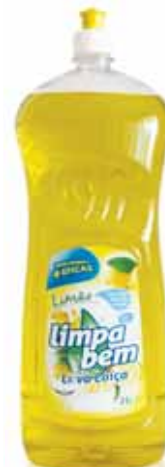
Limão Lemon Citron Limón

500 ml Un. p/Cx: 1x12 Cód.: 5600441622103