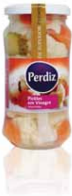
Pickles Frasco Pickles Vial Bouteille de Pickles Encurtidos Frasco

180 gr Un. p/Cx: 1x12 Cód.: 5600441613262