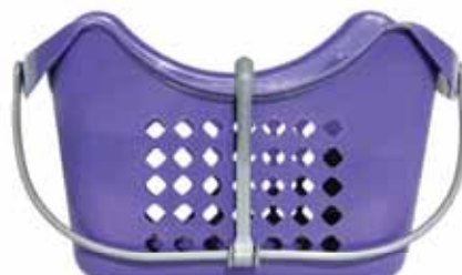
Cesto para Molas Roupá Basket Spring Clothing Vêtements Panier Springs Cesto p/ Pinzas Ropa

12 un Un. p/Cx: 6x12 Cód.: 5600441668125