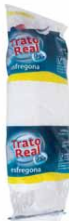
Recarga (Microfibra de Poliéster) Refill (Microfiber Polyester) Recharge (Polyester Microfibre) Recarga (Microfibra de Poliéster)