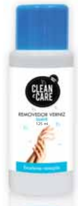
Suave Smooth Suave Suave

60 ml Un. p/Cx: 1x12 Cód.: 5600441650250