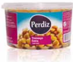
Tremoço Extra 13/15 Extra Lupin 13/15 Lupin Extra 13/15 Altramuz Extra 13/15

300 gr Un. p/Cx: 1x12 Cód.: 5600441613316