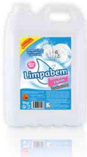
Detergente Líquido Loiça Máquina Washer Machine Liquid Detergent Détergent Liquid Pour le Lave-Vaisselle Detergente Líquido Loza Máquina