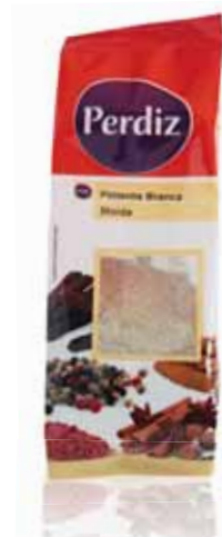
Pimenta Branca Moída Milled White Pepper Poivre Blanc Moulu Pimienta Blanca Molida