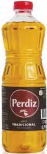
Tradicional Traditional Tradicionnelle Tradicional

0,75 Lt Un. p/Cx: 1x12 Cód.: 5600441614115