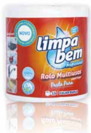
Rolo Multiusos Multipurpose Rolls Rouleaux Polyvalent Rollo Multiusos

1 = 15 Un. p/Cx: 1x6 Cód.: 5600441628327