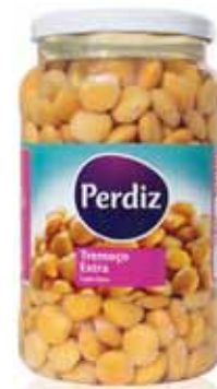
Tremoço Frasco 13/15 Lupin Vial 13/15 Lupin Bouteille 13/15 Altramuz Frasco 13/15

220 gr Un. p/Cx: 1x12 Cód.: 5600441613309